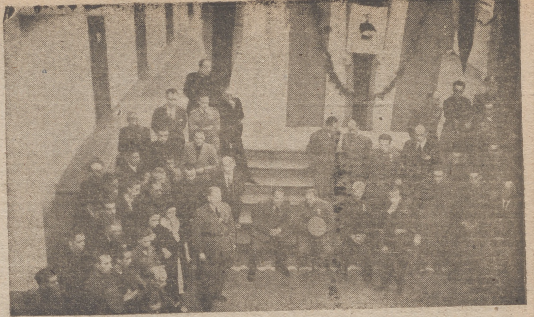
En la Prisión Provincial, jerarquías y autoridades escuchan el coro formado por los reclusos.