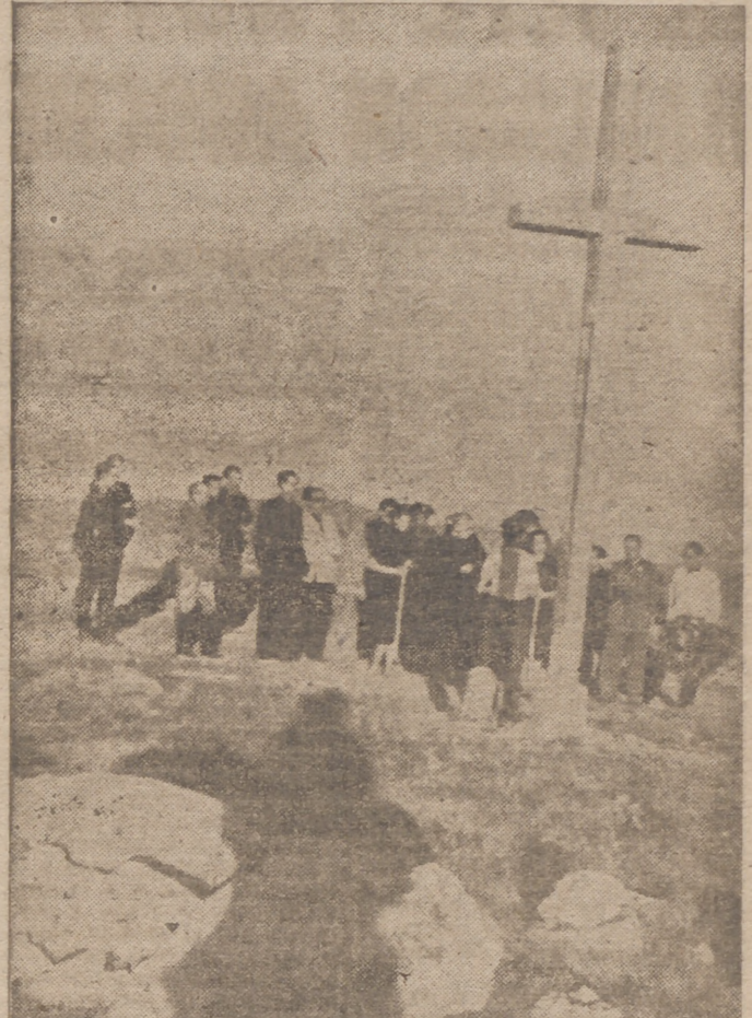
He aquí el momento del rezo de una de las Estaciones, ante la Cruz que la preside, en el «Alto de los Leones de Castilla»

La Habana, 24. - En la conferencia que a puerta cerrada han celebrado hoy el ministro de Negocios Extranjeros yanqui, Hull, y su colaborador Berle, actualmente presidente de las discusiones, con otras delegaciones acerca de las colonias europeas en América y otros asuntos económicos, se ha insistido para que las decisiones sean tomadas lo más pronto posible. En consecuencia se ha fijado el mediodía de mañana, jueves, como límite para recibir proposiciones. En la tarde de mañana las materias sometidas por todas las delegaciones serán repartidas a las diferentes comisiones. El sábado por la tarde se celebrará una sesión plenaria y el 30 de julio será la fecha de la sesión de clausura. Se sabe que para la protección de las colonias europeas, Hull ha propuesto un compromiso de control para cada colonia, realizado por una Comisión compuesta de tres Estados que serán los más interesados por razones geográficas y estratégicas en cada colonia. Se discute, por ejemplo, la implantación de un régimen aduanero unitario en los veintinueve países en lo que concierne a la designación de mercancías y a la uniformidad de pesas y medidas, así como a la evaluación de valores. La delegación mejicana ha exigido que los capitales de otros países americanos, aludiendo a los de los Estados Unidos, no se sitúen de manera que implique una absorción imperialista de la rama industrial. Efe.