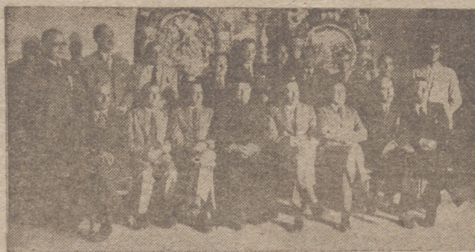
El gobernador civil y las autoridades en el acto de entrega del Via-Crucis que regala la C. N.-S. para el Santuario Nacional del Corazón de Jesús.

Todas las informaciones coinciden en señalar que el tema de la conferencia será las reivindicaciones húngaras sobre Transilvania.