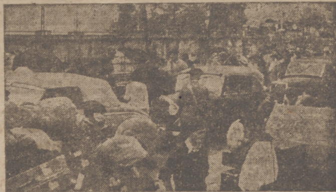
Un aspecto de la frontera de Irán por donde estos días llegan de Francia, huyendo, gentes de todas las clases y de todas las razas.