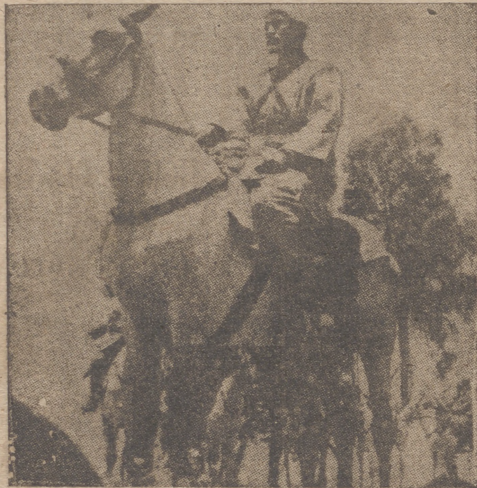
Tropas jalfianas de guardia en Tángar

Los franceses transmitieron ayer a su Gobierno las condiciones del armisticio, de manera que el Gobierno francés ha tenido ya ocasión de examinarlas. A las 10.20 horas la Delegación francesa se trasladó de nuevo al vagón, donde ha tenido una vez más ocasión de comunicar telefónicamente con su Gobierno».—Efe.