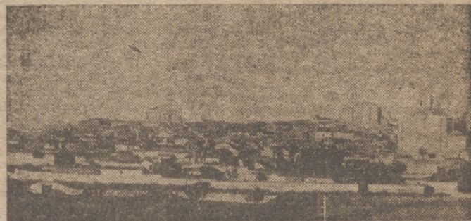
MEDINA DE RIOSECO, la histórica ciudad de los Almirantes, con sus templos de traza catedralicia

Continuamos nuestra labor de recorrer los pueblos de Castilla para ponernos en contacto con sus habitantes—modelo de españoles servidos, res y leales a los destinos de la Patria— para pulsar sus necesidades, que llevadas a las autoridades puedan encontrar justa y acertada solución; para recorrer las rutas magníficas de nuestros días de gloria, que como cuentas de un rosario interminable se hallan esparcidas a lo largo de los caminos, en los rincones de las casas señoriales, en las naves de nuestras iglesias milenarias y en los campos heroicos preñados de gloria de la noble Castilla. En épocas pasadas, todo esto eran las rutas concurridísimas de nuestro turismo; hoy, olvidadas y en segundo término, han perdido importancia y es necesario llevar al convencimiento de las gentes de dentro y de fuera de España que en ellas reside la levadura y solera de nuestra manera de ser y de nuestra razón de existencia.