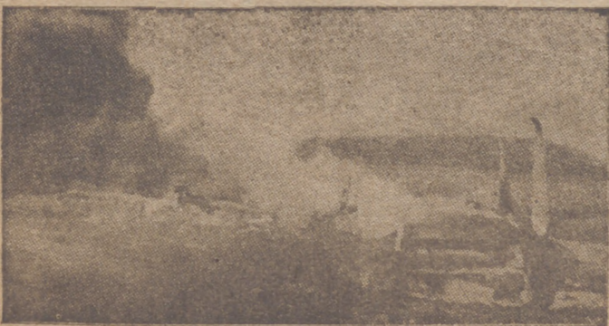
Un avión inglés, incendiándose

A partir del número del martes, LIBERTAD publicará crónicas del enviado especial de la agencia Efe en Francia, Manuel Aznar, con carácter exclusivo para nuestro periódico