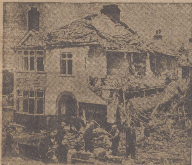
Los aviones ingleses bombardean casas apropiadas como esta

También ha descendido otro avión francés en una playa inmediata a la capital, en la región de Levante. Tripulaban el aparato tres oficiales, un radiotelegrafista y dos mecánicos. Todos ellos quedaron a disposición de las autoridades. Han manifestado que efectuaron el descenso por haber observado cierta avería en el avión.—Cifra.