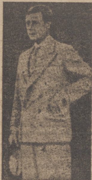
EL DUQUE DE WINDSOR que se encuentra en España

gran nube de humo que salía de un gran buque de guerra que se encontraba anclado en el puerto. Efe.