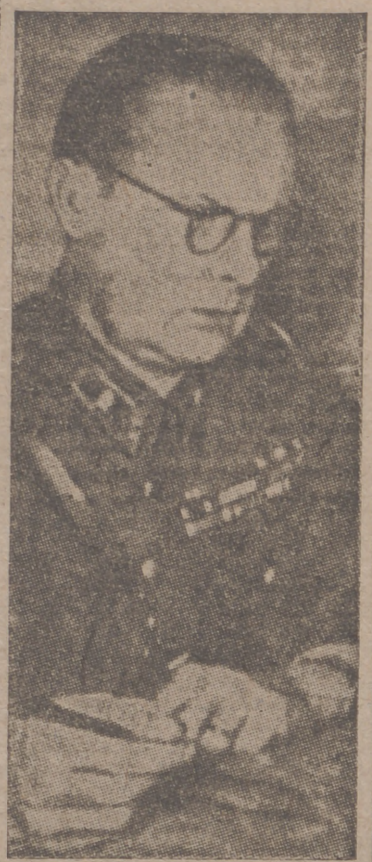
El general Wil-Go Tuompo, comandante de las tropas finlandesas en el frente Norte