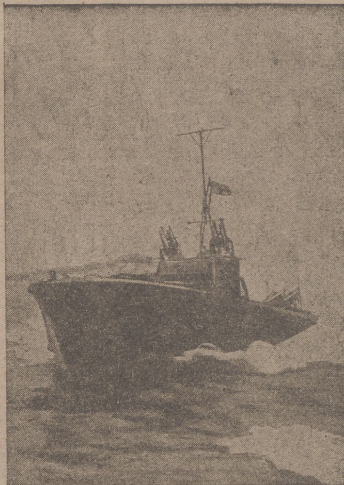
Una de las caños a motor, verdaderos torpederos en miniatura, armadas de ametralladoras, torpedos y granadas submarinas, que son dedicadas a la vigilancia de las costas inglesas.

Concluido el discurso, y después de dar la Bendición Apostólica a todos los presentes, el Pontífice dió a besar su mano a todos y cada uno de ellos y concedió después una audiencia privada al embajador de España y al jefe de la Misión naval. Efe.