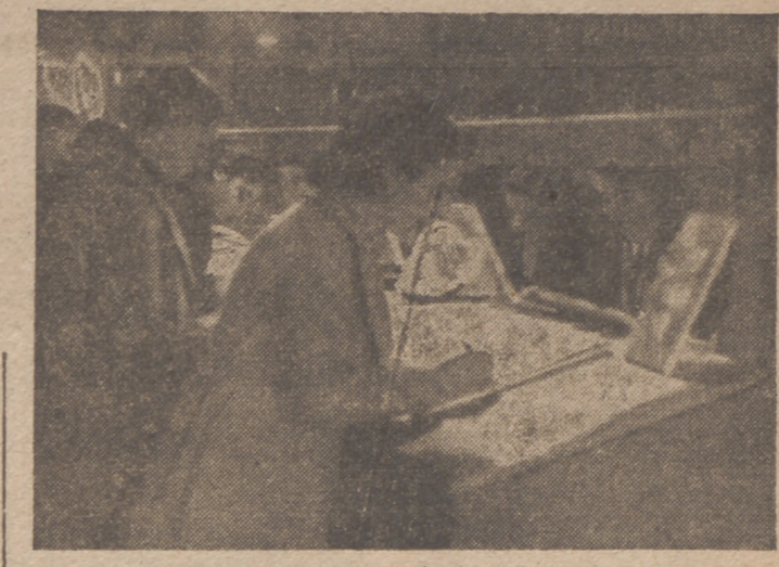
En clase de Dibujo, donde las alumnas han logrado grandes progresos

1.ª sección.—Instrucción primaria. A esta sección están afectas las escuelas de la C. N.-S., establecidas en las barriadas de La Farola y La Rubia. En un ambiente nacional-sindicalista reciben los alumnos las primeras nociones. Al cumplir la edad escolar de los catorce años, los que reúnen condiciones suficientes pasan a este Centro de Estudios. Para el ingreso en las citadas escuelas, que sostiene la C. N.-S., es requisito indispensable la autorización de la Central. Se atiende con preferencia a los hijos de los afiliados, y cuando sobran vacantes, a los niños más necesitados, de acuerdo siempre con la C. N.-S.