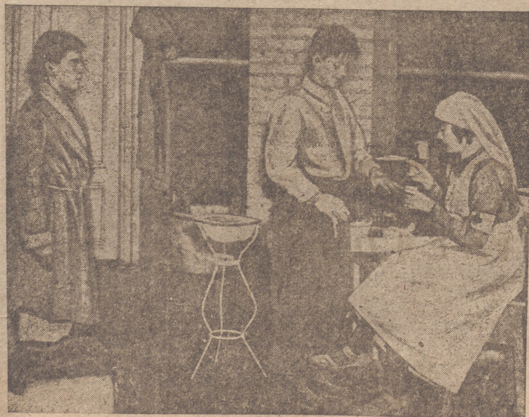
Muchachos finlandeses de 14 a 16 años se presentan voluntarios como donadores de sangre para las transfusiones. He aquí dos en una enfermería.

Helsinki, 23.—El enviado especial de la Agencia Stefani señala que la niebla y el mal tiempo que reina en el istmo de Carelia impiden los planes del Estado Mayor soviético, que debe, por otra parte, superar grandes dificultades para hacer avanzar rápidamente enormes masas de hombres y material. Otro grave obstáculo lo constituye la aviación finlandesa, que ha concentrado sus esfuerzos en la retaguardia enemiga del istmo de Carelia y ha logrado desorganizar, con su intensa actividad, las comunicaciones y el aprovisionamiento del enemigo.—Efe.