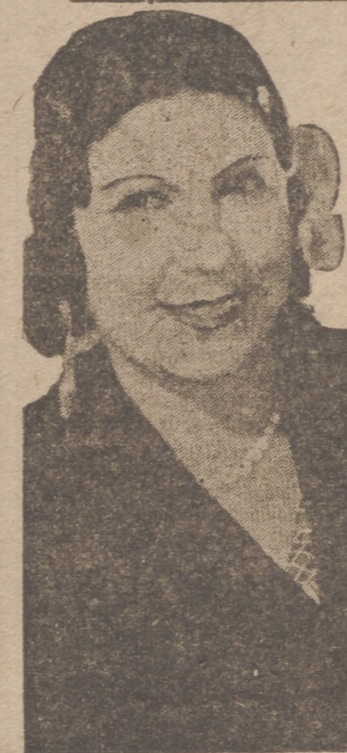
PASTORA IMPERIO, que en el campo del cine ha sabido encontrar un hueco