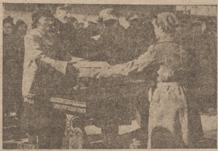
La distribución del «Dono del Duce» a los militares de guarnición en Tirana