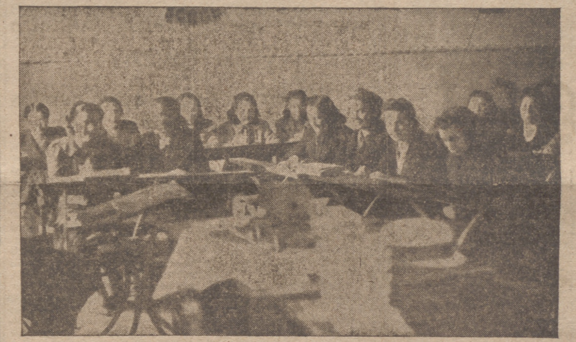
Las camaradas del Centro de Estudios Onésimo Redondo escuchan con toda atención las explicaciones de un profesor

Marchamos contentos de la simpática visita y tristes a un tiempo, pensando en lo mucho que podría hacerse si se contara con más medios en este Centro, presidido por el nombre del Caudillo Onésimo Redondo, y donde el entusiasmo y la fe nacional-sindicalista suplían aquella falta.