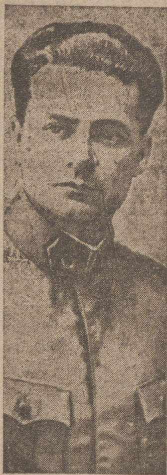
ESTIGARRIBIA, presidente de la República paraguaya