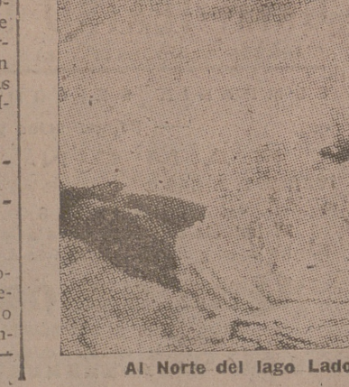
Al Norte del lago Ladoga soldados finlandeses defienden valientemente una posición

Roma, 19.—Comunican de Amsterdam que el barco alemán «Pinnau», matriculado en Stettin, ha sido atacado por un submarino soviético en el golfo de Boinia, a la altura de las islas Alianti. El submarino disparó 57 cañonazos, sin lograr hacer blanco en el navío. El «Pinnau» había izado la bandera con la cruz gamada. —EFE.