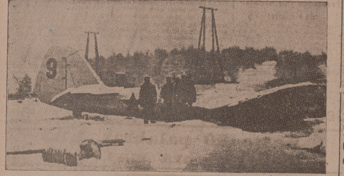
Un avión ruso abatido por los finlandeses cerca de Viborg