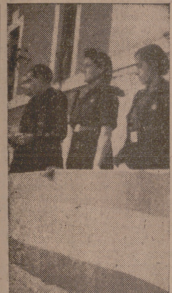
Celebró el domingo la Sección Femenina de la Falange la festividad de su Patrona, Santa Teresa de Jesús.