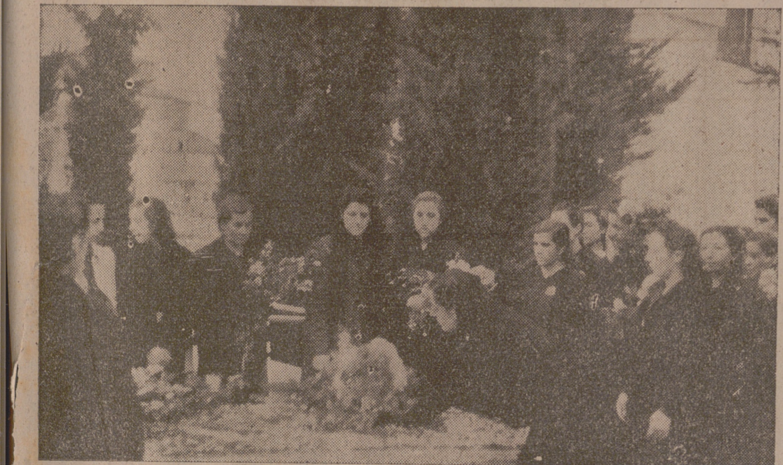
Camaradas de la Sección Femenina depositan coronas de flores sobre la tumba de Onésimo Redondo

Berlín, 16.—El mando supremo del Ejército comunica que el mismo submarino que hundió al «Royal Oak» ha torpedeado al barco de guerra «Repulse», acorazado inglés, al que causó tan grandes averías que tuvo que ser remolcado a puerto.—DNE.