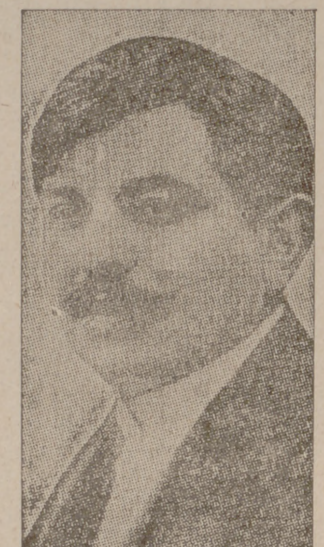
LAVAL, que pide el envío de un representante diplomático a Burgos