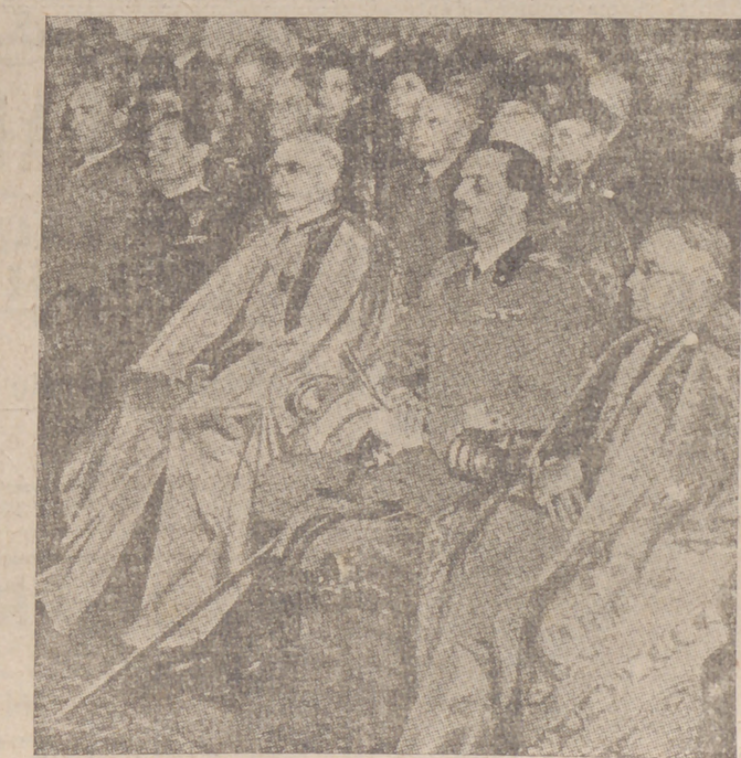
Roma.—Los cursos de estudios romanos, inaugurados en la Sala Borromini, con asistencia del príncipe de Piemonte.

RESTAURANT "CASA ALICIA" Servicio a la carta Sombrerería, 8.—BURGOS