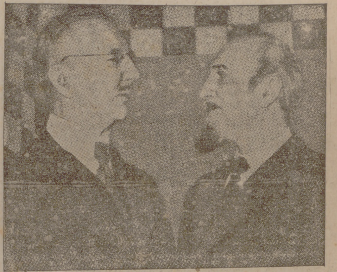
En Londres, el doctor Schat, ministro de Economía del Reich, hablando con el señor Montagu Norman, gobernador de la Banca de Inglaterra a la derecha)