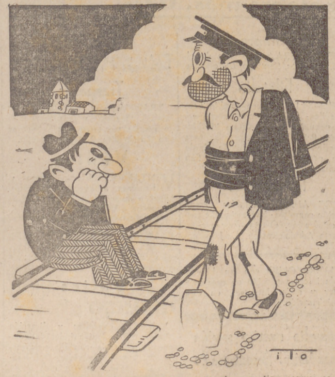
—Deseo que usted que es, estar algunos días porque es...