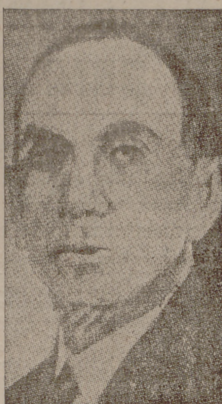
Daniel C. Raper, ministro de Comercio yanqui, que ha limitado a consecuencia de la colosal estafa descubierta en los Estados Unidos