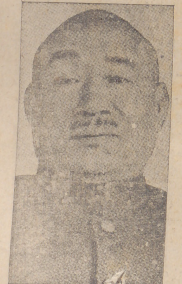
El general Sugiyama, que ha sido nombrado comandante en jefe de las heroicas fuerzas japonesas que luchan en la China del Norte