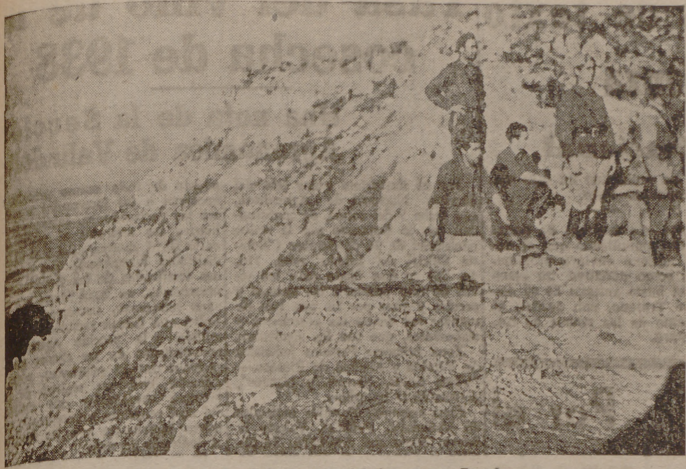
Los altos de Daballs conquistados para España