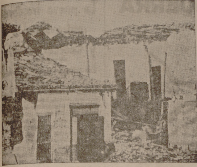
Un rincón del "Barrio del Lucero", machacado por los morteros

El frente de Madrid, en los primeros meses del año 1937, seguía siendo un hervidero.