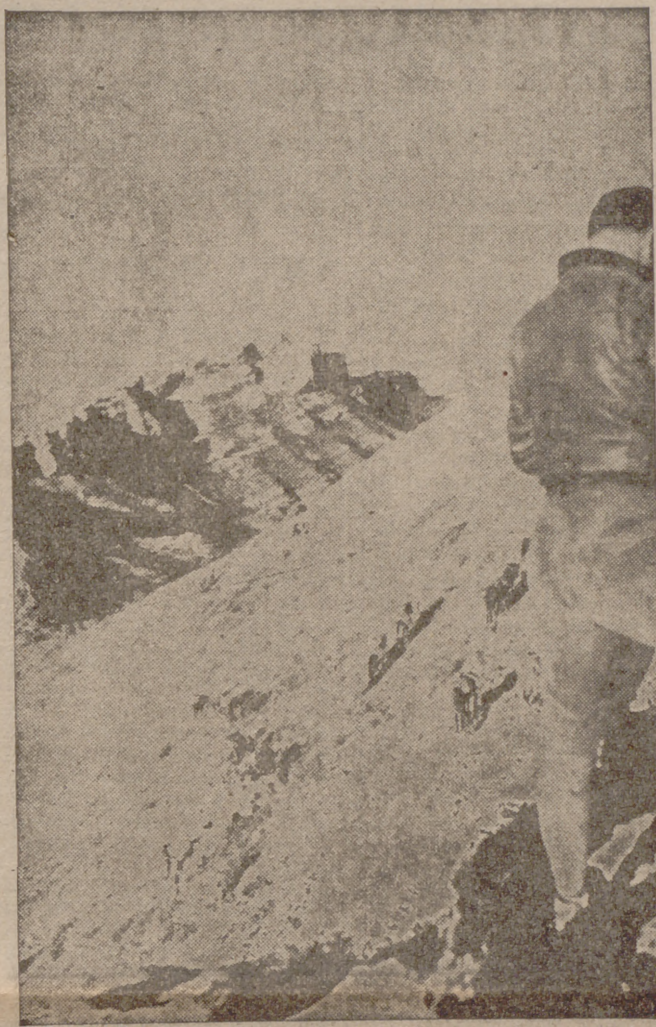
Por aquí subieron los moros y la Legión hacia Caballs