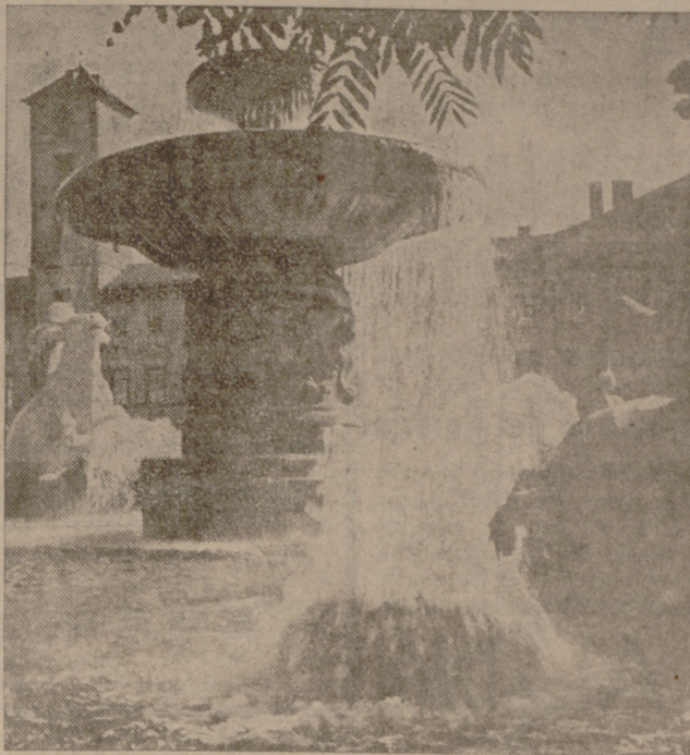
La fuente de Wittelsbach en Munich