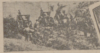
7 de septiembre de 1938