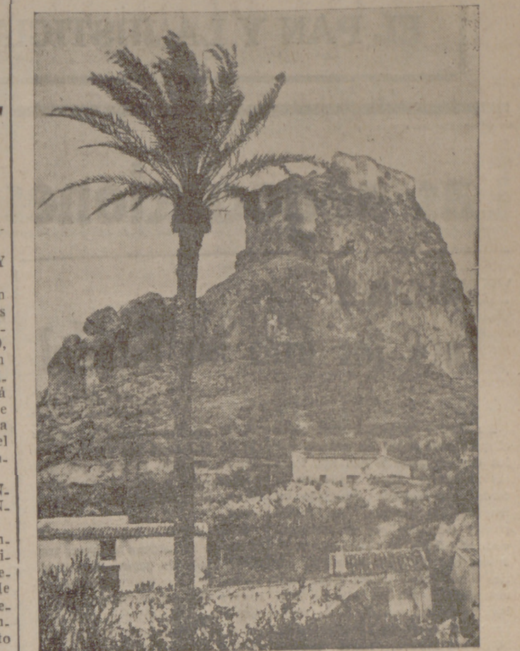
MONTE AGUDO (Provincia de Murcia)