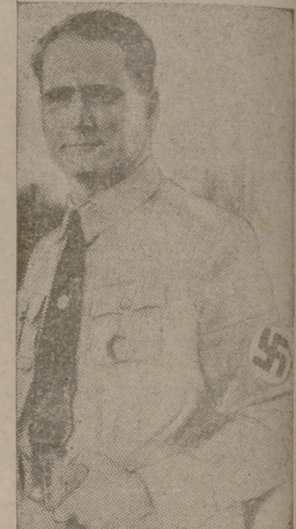
RUDOLF HESS, Lugar-teniente de Hitler