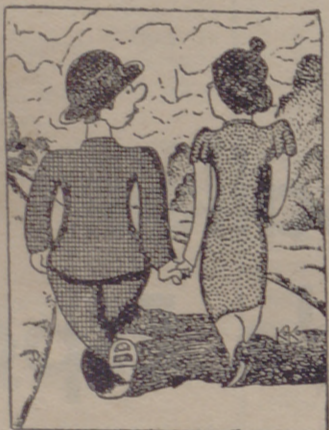
LA NOVIA.—Tú que sostienes que no hay dos personas con las mismas ideas, cambiarás de parecer en cuanto te enseñe los regalos de boda que me han hecho mis amigas.

Yo recuerdo ahora de cuándo se habló, hace unos meses, de la venta o desaparición de la copia del poema del Cid; es como si la bota marxista, hubiera pisado en el barro la intimidad de España.