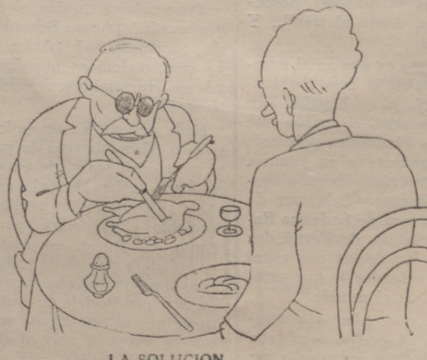
LA SOLUCION —Yo no recuerdo haber visto jamás a usted con gafas verdes, don Estanico. ¿Hace mucho que las usa? —No. Un par de meses. Desde que el médico me puso a verduras.