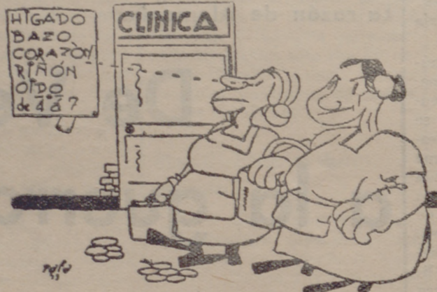
—¡Mira que somos tontas! ¡Una hora preguntando por una carnicería, y la tenemos delante de las narices!