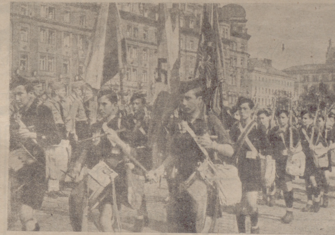
Los flechas que marcharon a la nación amiga invitados por la Juventud Hitleriana, desfilando por una de las avenidas de Munich

Desayunamos en el Cuartel de Falange, y cuando a las diez, al dejarlos salir a "dar una vuelta", se les dice: "Los de Alemania llegan a la una. Media hora antes tenéis que estar en la estación", se ve en las caras de todos que sobre esta advertencia. Están deseando encontrárselos.