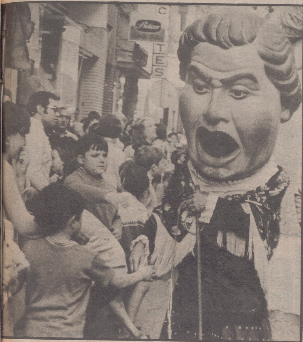
Gigantes y cabezudos volverá a producir el regocijo de la chiquillería