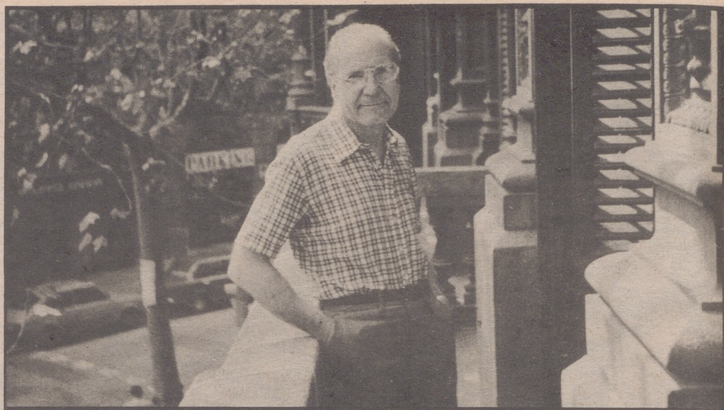
puede decir con una Generalidad en funcionamiento?

Veamos qué nos cuenta ahora el nacionalismo catalanista sobre la emigración y las relaciones actuales y futuras entre las dos comunidades.