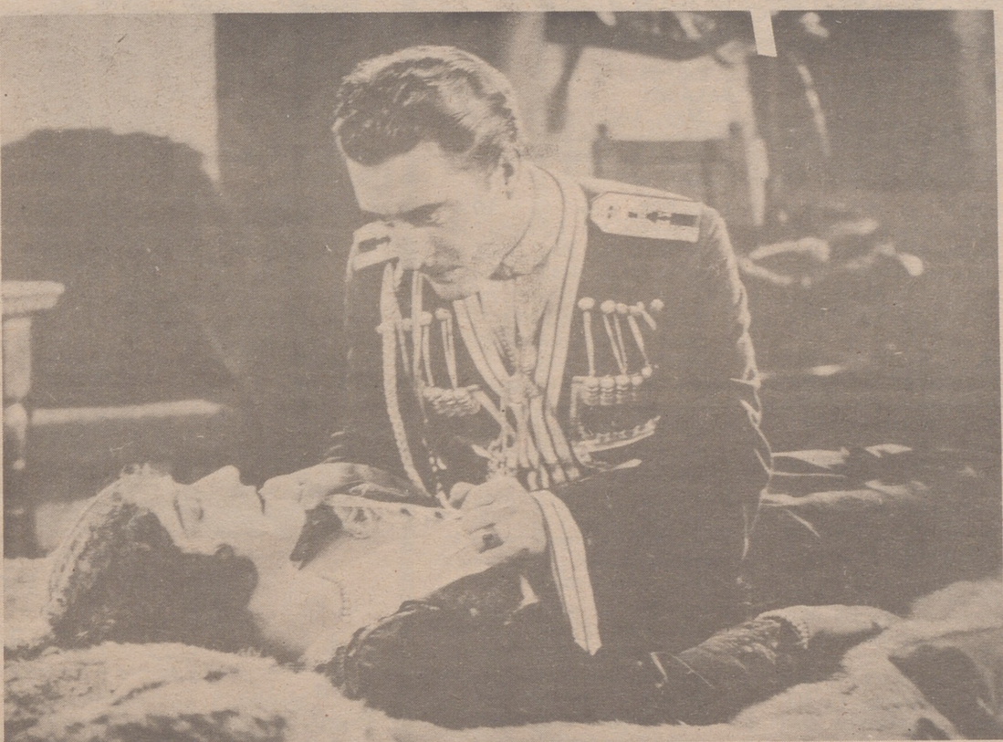
Los climas de opereta, el estilo definido "puritano", podemos apreciarlo en esta escena de "Su hora", en la que aparecen John Gilbert y Aileen Pringle.

de la aventura, cuyos modelos eran ciertas operetas ambientadas en pequeños reinos, con príncipes cuyas obligaciones palaciegas les hacía sentirse desgraciados, pues su mirada se había posado en una pastora bella y rubia. Ruritania no podía existir en otra mente que la de Elinor Glyn. Ciertamente que muchas operetas han cantado las apacibles costumbres de estos reinos minúsculos, donde el príncipe o la princesa son prisioneros de sus deberes. Anthony Hope, lo describió en "El prisionero de Zenda", novela que animaba una tremenda conspiración para derrocar a uno de estos reyes soñadores, pesados de su destino. Hollywood, en diversas ocasiones, captó los suspiros desesperados de un príncipe bajo el terrible "peso de su aciago