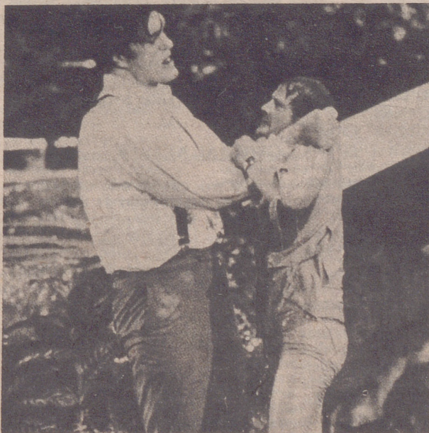
¿SE SUBIRA A UNA ESCALERA SU MUJER PARA PEGARLE?

Pues nada que hay que tener cuidado con las, (i y los!), fans demasiado impulsivos, que si Pecos estuvieron a punto de sufrir al ataque de cientos de admiradoras, al tiempo que ellas corrían el peligro de electrocutarse, ya que llegaron a manosear un cable