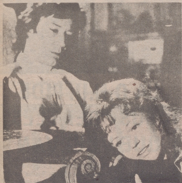
EL AMO ROSS FUE SEDUCIDO POR DEMELZA

Otra vez se está poniendo de manifiesto, (y lo que te rondará morena), la falta de planificación existente a veces, muchas, en TVE. Ahora le ha tocado a "Grandes relatos" que en pocas semanas va a ser testigo de la mayor desorganización que puede llevar a cabo en una "gran casa" como es la de nuestra TVE, (que a pesar de todo, sigue siendo nuestra, de todos los españoles).