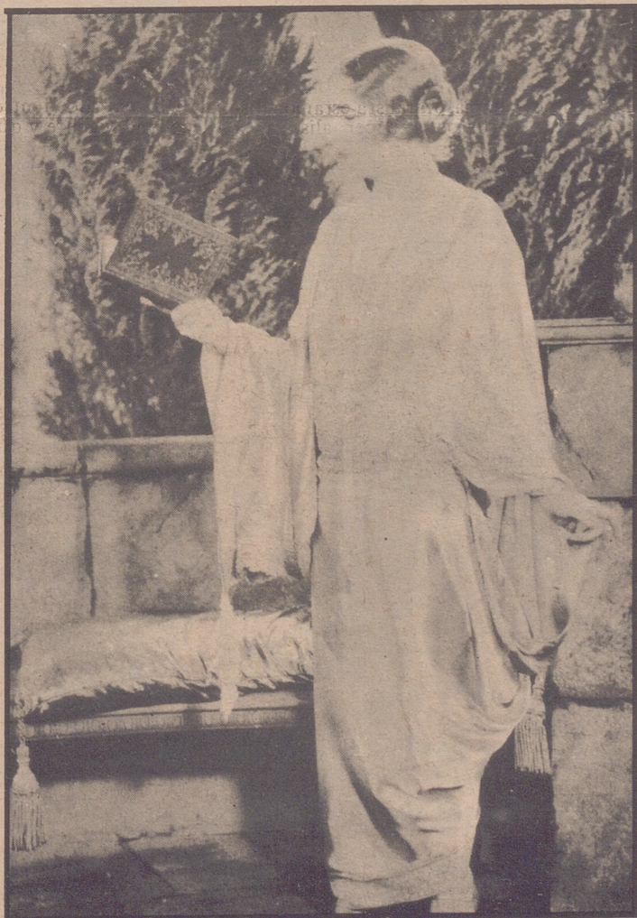
Elinor Glyn en 1928, casi al final de su reinado hollywoodense, cuando sus ideas y conceptos estéticos eran tomados muy en cuenta en la ciudad del cine.

El reino que intentó imponer Elinor Glyn en el sofisticado Hollywood de los veinte, es el país que bullía en la mente de "Madame", con esa visión que tienen las sirvientas de la clase elevada, y que en los llamados años locos era frecuente hallar en ciertos sueños de cenicienta por la chica que espera pacientemente la llegada de su príncipe azul. Elinor Glyn crea para sí su imaginario reino ruritiano, que tanta influencia habría de tener en los relatos amasados con la fuerza del romanticismo y la evocación