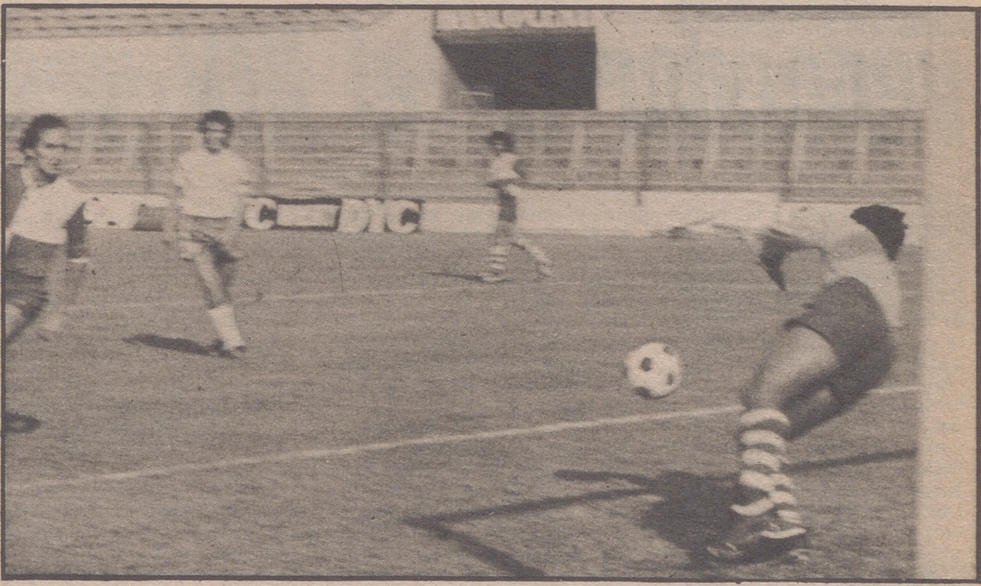
Así consiguió el Aragón su primer gol.

gundo tiempo, Paquito al saque de un libre indirecto, de excelente tiro consigue el último tanto del partido. Con mucho calor y pocos aficionados, en La Romareda ha iniciado la temporada futbolística el Aragón, ante un Ciempozuelos de una muy baja calidad. El partido realmente tampoco fue bueno ni mucho menos, ya que salvo los 20 primeros minutos, el equipo local jugó andando, sin conexión en sus líneas y mostrando ausencia de remate. Lo cierto es que aunque se ganó el equipo no convenció,