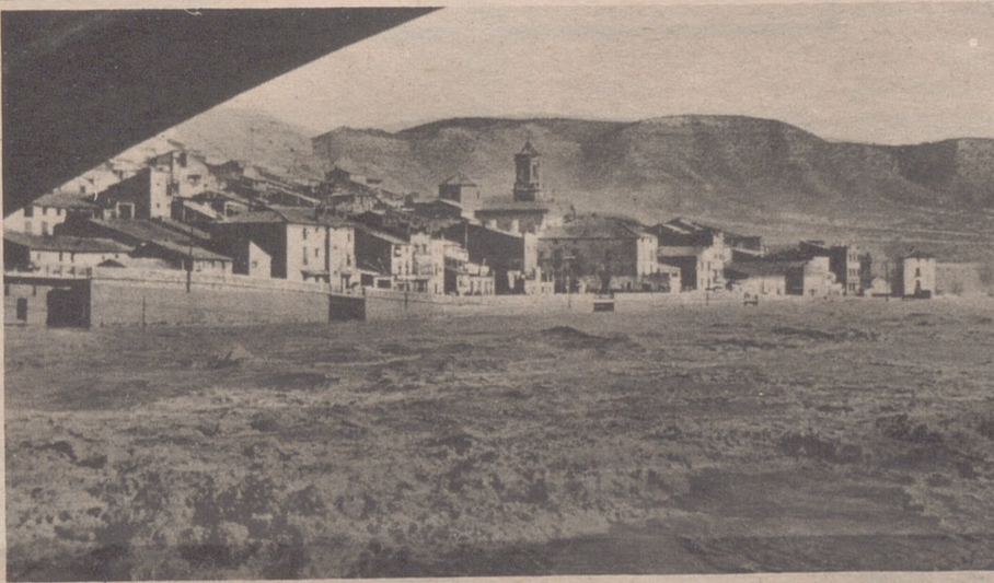
Mequinenza viejo y Mequinenza nuevo. Entre los dos, quince años de lucha, muchos problemas y la incertidumbre ante el futuro

EN SU ESCRITO AL GOBERNADOR, 163 VECINOS DENUNCIAN NUMEROSAS IRREGULARIDADES.