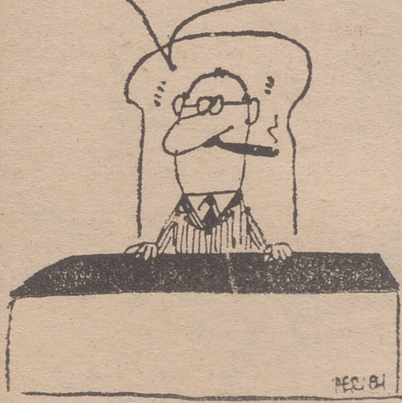
Perich, en "LA VANGUARDIA"

NO SE DE QUÉ SE QUEJAN... EL NIVEL DE VIDA DE ESTE PAÍS, QUE TENGO YO, ESTA MUY BIEN