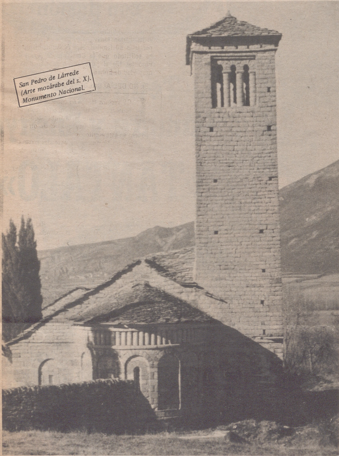
San Pedro de Lárrede (Arte mozárabe del s. X). Monumento Nacional.

L A paz sea contigo, Martín Fortún de Lárrede. Te saludo, aunque cortés y menos "pomposamente" que los mozárabes tenemos por costumbre que, a usar de nuestra retórica y finura, puede que diera fin a tu paciencia antes de que remataras de leer mi salutación y permite que un pobre mozárabe eche también su cuarto a espadas en la tremebunda lucha que os tiene boquiabiertos a los antiserrablitas.