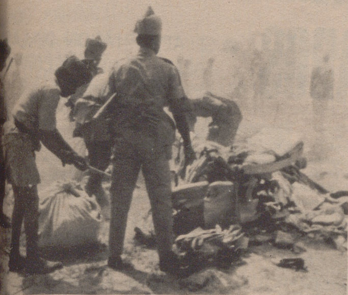
NUEVA DELHI.— Soldados indios han participado en el rescate de las víctimas del avión DC-8 de las líneas aéreas japonesas en el que por lo menos 84 personas perdieron la vida.