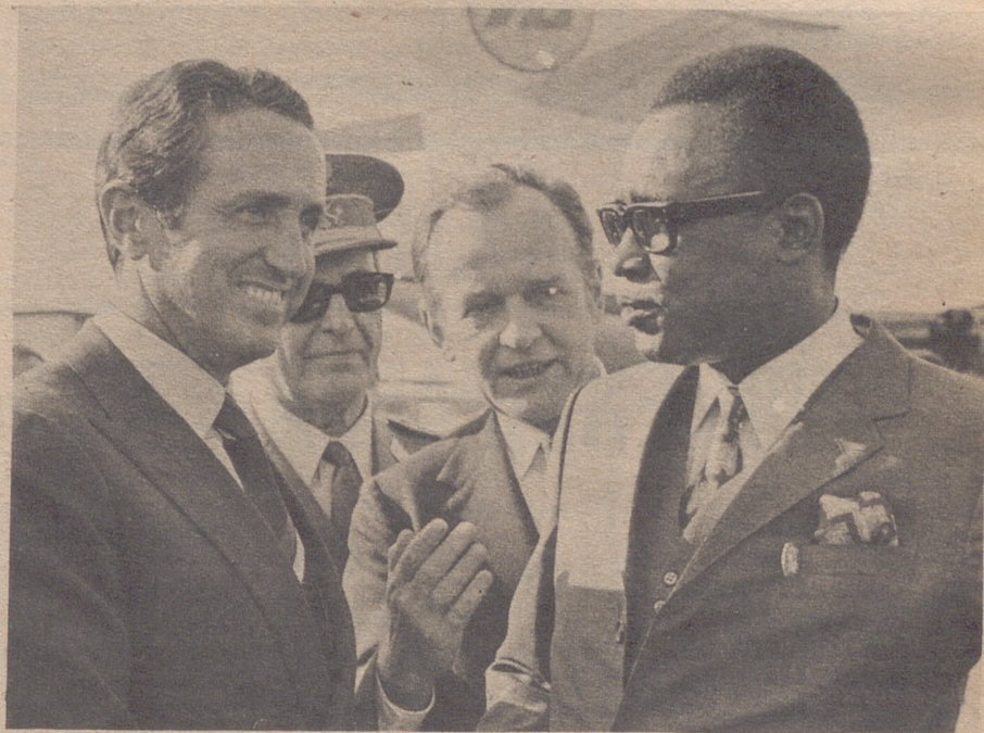
MADRID.— El General Mobutu, presidente de la República de Zaire, a su llegada al aeropuerto de Madrid-Barajas, en visita privada. Fue recibido por su esposa, (que había llegado por la mañana) y el Ministro español de Asuntos Exteriores, señor López Bravo, y otras personalidades. (Foto: Europa Press).