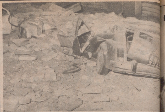
ANCONA (Italia).— Vista de los desperfectos ocasionados en algunos edificios en el terremoto de Ancona (Italia) la pasada noche en esta ciudad de 100.000 habitantes.

en la que, según se asegura, manifestó que fue secuestrado por un grupo de desconocidos que se hicieron pasar por policías y le sometieron a un intenso interrogatorio en torno a las actividades de la empresa en la que presta sus servicios. Al parecer, el técnico afirmó igualmente que fué tratado con corrección en todo momento e incluso se le facilitaron medicinas para combatir la hepatitis que padece.