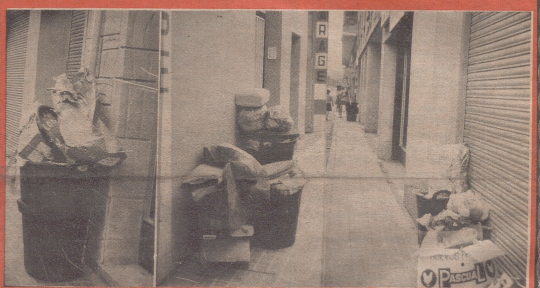
Algunas zonas de la ciudad, desde hace cuatro días tienen las basuras sin recoger del todo. El enfrentamiento entre los empleados y la empresa concesionaria de la limpieza, por motivos económicos, es la causa de esta irregularidad. Ayuntamiento y empresa estudian ahora la solución. (Amplia información en pág. 5).-(Fotos García Luna).