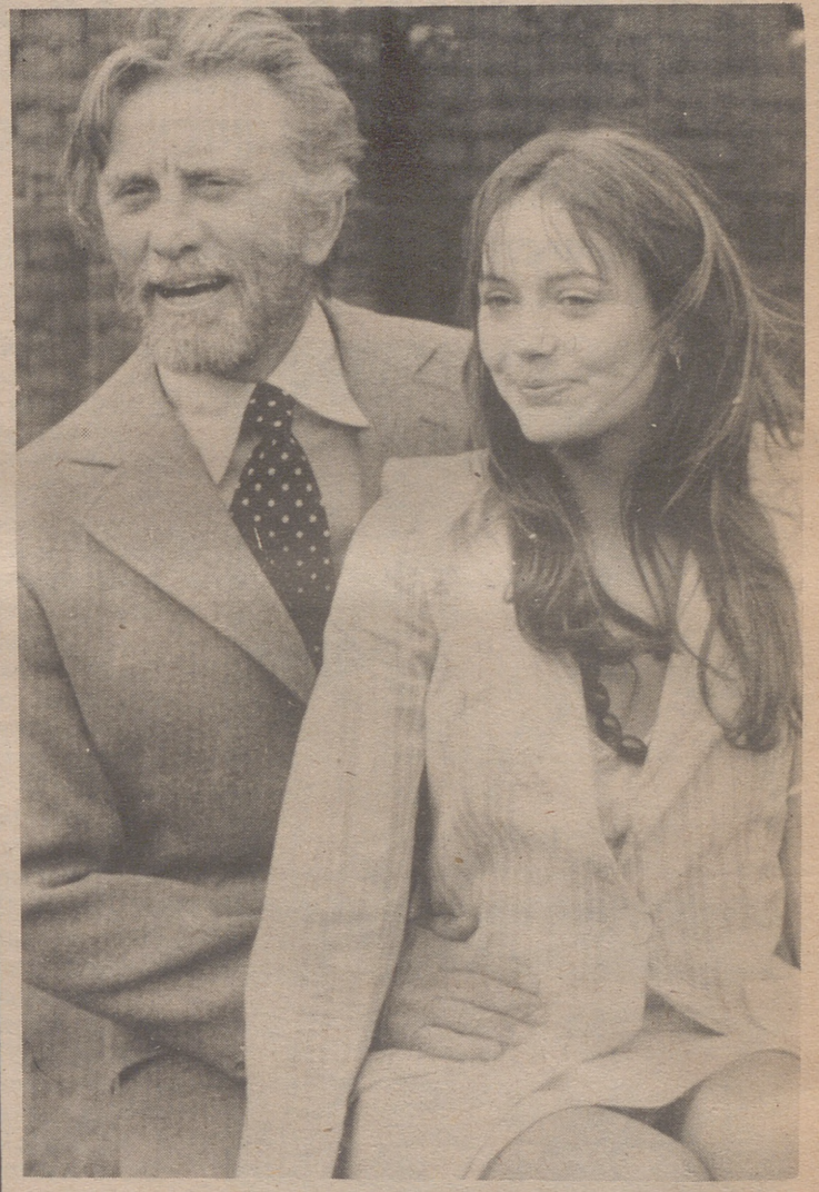
LONDRES.— El actor americano Kirk Douglas con la actriz de 19 años, Lesley Anne Down, una de las dos "estrellas" de la película "SOALAWAG", que el mismo Kirk dirigirá y será productor, en su debut (sobre todo como director). La otra "estrella" es el muchacho Mark Lester, que fue el intérprete de "Oliver". La película se rodará en Yugoslavia.