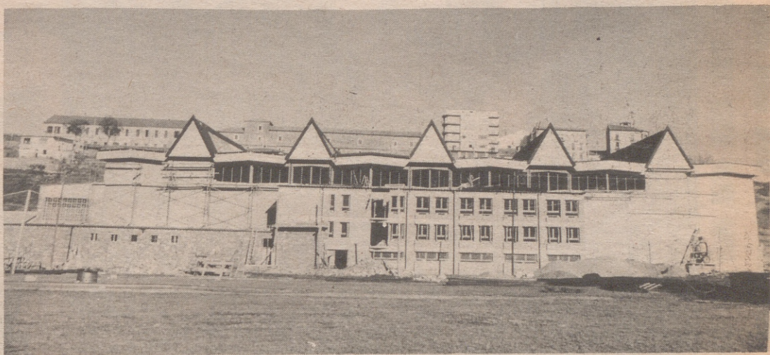
Vista exterior del Palacio del Hielo de Jaca.

DESDE el pasado sábado, Aragón cuenta con la mayor pista de patinaje sobre hielo de España. Jaca, esa pequeña pero tremendamente emprendedora ciudad del Pirineo aragonés, ha sido capaz de poner a punto, en el plazo de un año, unas instalaciones que pueden ser llamadas con toda propiedad Palacio del Hielo. El 23 de marzo del pasado año comenzaron las obras en los terrenos que antiguamente ocupaba el campo de fútbol, junto a la ronda exterior que une las carreteras de Pamplona y Sabiñánigo. En agosto se había terminado lo más esencial del edificio, de modo que pudo albergar al IX Festival Folklórico de los Pirineos. El sábado pudimos ya patinar sobre la helada superficie de su pista.