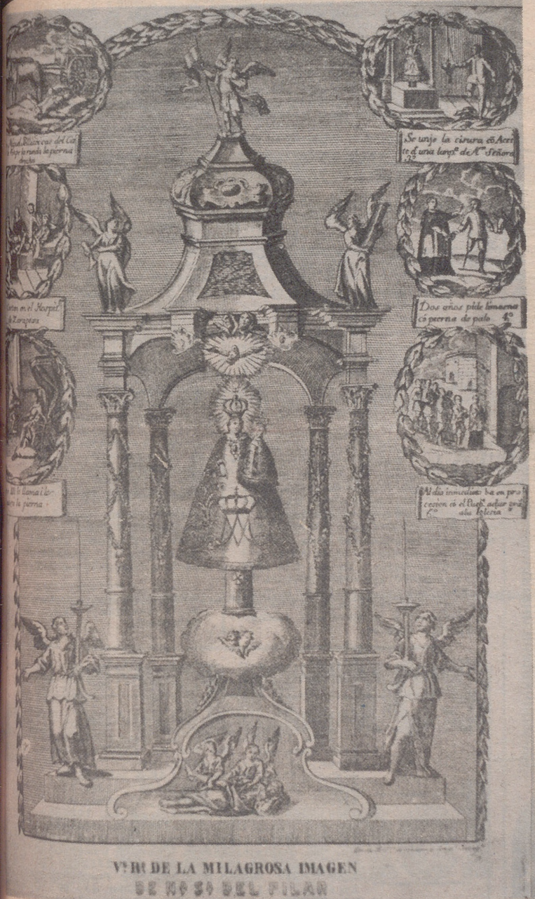
VIRGEN DE LA MILAGROSA IMAGEN DE NUESTRO SEÑOR DEL PILAR