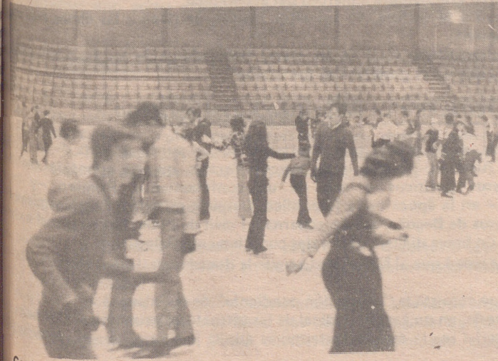
Centenares de patinadores disfrutaron ya el sábado y domingo últimos, de esta magnífica pista helada.

La lámina de hielo tiene unas dimensiones de 30 por 60 metros.