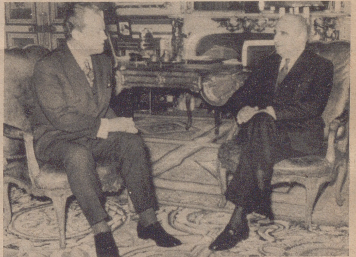
PARIS. — El presidente Pompidou en su despacho durante su entrevista con Willy Brandt que llegó ayer a París para una visita de dos días.

PARIS, 11. (Efe).— El Presidente Pompidou y el canciller Willy Brandt han dado comienzo esta mañana en el palacio del Eliseo la tercera y última de sus entrevistas de la tanda de conversaciones franco-alemanas que se están desarrollando en París.