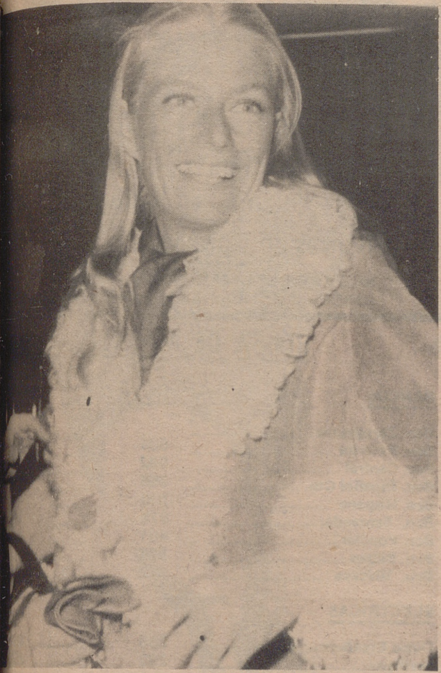
● NINA SIMONE - La cantante Nina en el aeropuerto de Londres desde donde se dirigirá a Nueva York para testificar en el Caso Hughes-Irving, sobre la biografía del millonario americano.