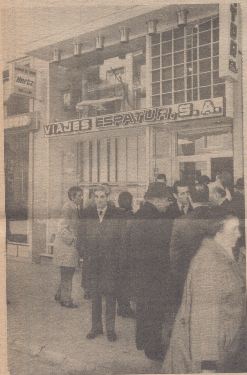
Magnífico aspecto de la fachada de la Agencia de Viajes «Espatur, S. A.», que quiere ser un puente entre Zaragoza y el resto del mundo.—(Foto. PARIS).

DOTADA DE MUY MODERNAS INSTALACIONES, Y ATENDIDA POR PERSONAL MUY COMPETENTE, ESTA AGENCIA TIENE SU SEDE EN LA CALLE DE SAN JUAN DE LA CRUZ, NUMERO 26