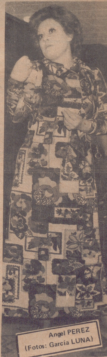
Angel PEREZ

Es Emma Penella, una de las mejores actrices del cine español.