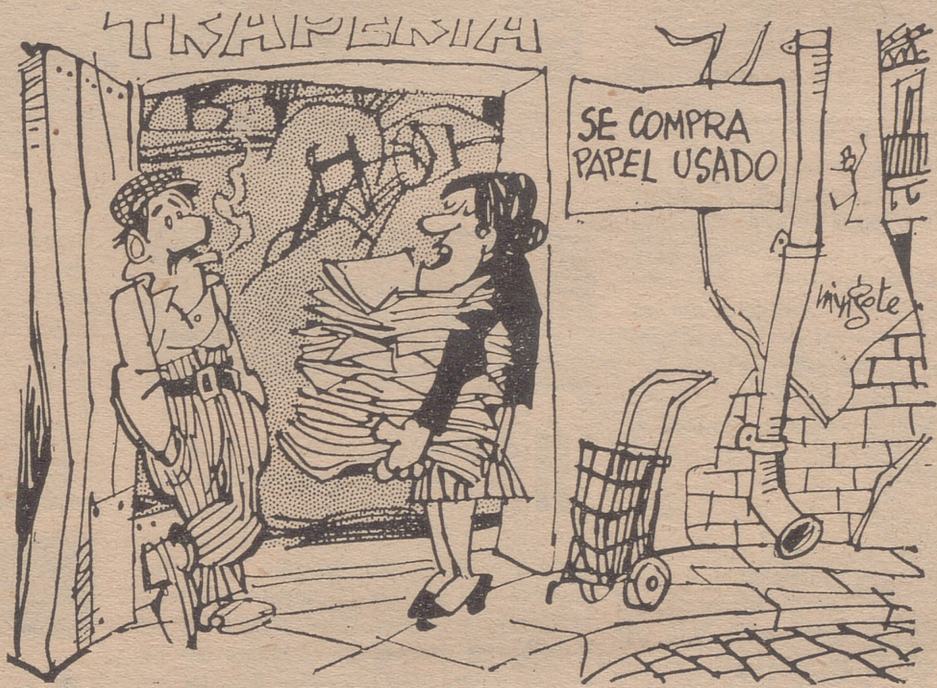
—Es un papel de buena calidad donde vienen todos los decretos, normas y disposiciones para evitar la subida de precios. Pero este año le va a costar más dinero.