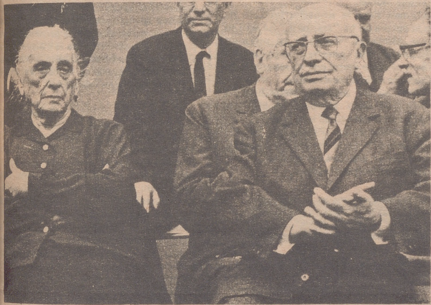
"La Pasionaria" con el comunista francés Duclós

Pronto puede darse el espectáculo de dos partidos comunistas españoles, uno auténtico y el otro espurio o bastardo, que predicen la misma unidad revolucionaria marxista-leninista. — Alfonso BARRA.