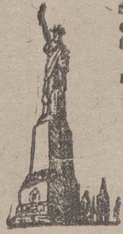
Servicio especial para nuestro periódico de la actualidad norteamericana

ES UN GIGANTE SILENCIOSO, QUE NO HABLA INGLÉS NI FRANCÉS; QUE NO CONOCE LAS RUTAS DE OCCIDENTE, PERO VISITA PEKIN, NUEVA DELHI, EL CAIRO, ETC., ETC.