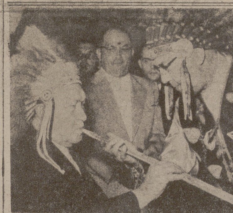
Adenauer fuma la pipa de la paz