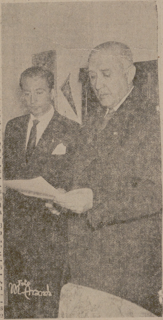
Grupos de Coros y Danzas tenían que llevar por el mundo el nombre de Logroño.