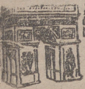
Servicio especial para nuestro periódico de la actualidad (francés)

LE GAULLE ANUNCIA QUE CONDENARA SIN APELACION AL REGIMEN Y SE IRA A THAITI