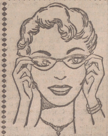
¿GAFAS AMOR? en Casa