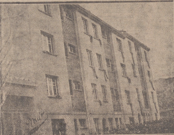
Los grabados, de arriba abajo, muestran: El primero y segundo momentos de la entrega de títulos a los beneficiarios de las viviendas del magnífico grupo recientemente inaugurado en Haro, y el tercero, un aspecto parcial del que también se hizo entrega días pasados en Arnedo y que igualmente constituye una acertada obra.