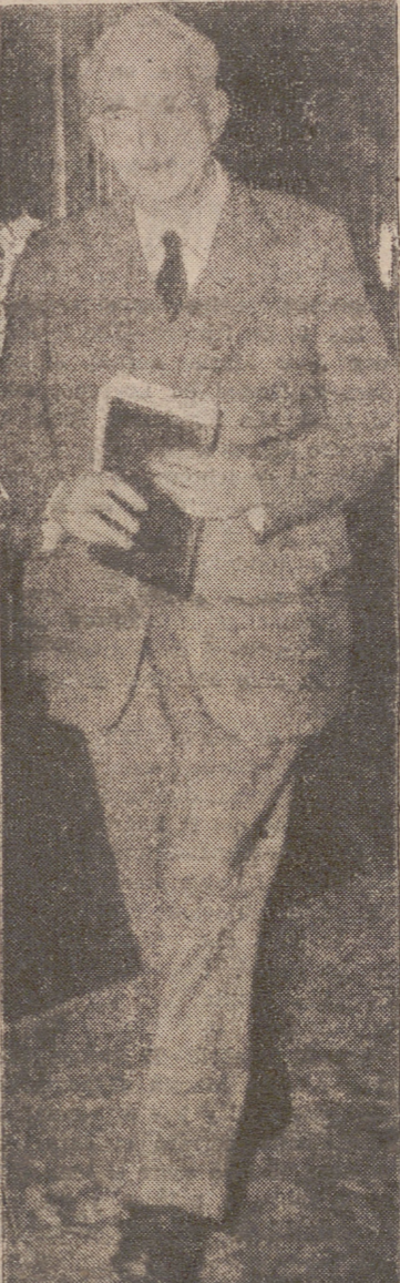
PARIS.—El embajador de España en París, conde de Casa Rójas, recibiendo del despacho del ministro de Asuntos Exteriores de Francia, M. Pinay, en el Quai d'Orsay, donde se entrevistaron para hablar sobre el problema de Marruecos.

ELECCION DE BRITANIA Y GRECIA SEDE DE LAS NACIONES UNIDAS, 20.—Después de ser elegidos para el Consejo Económico y Social Brasil y Grecia, la Asamblea General pasó a designar los países que sustituirán en el Consejo de Administración Fiduciaria a El Salvador y Siria, cuyos mandatos expiran a fines de año. Resultaron elegidos Gambia (en la primera votación) y Siria (en la tercera). En el orden del día figuraba una nueva votación para cubrir la tercera vacante del Consejo de Seguridad, pero el presidente, José Maza, informó que se estaban estudiando algunas sugerencias para una nueva votación para cubrir la tercera vacante del Consejo de Seguridad, pero el presidente, José Maza, informó que se estaban estudiando algunas sugerencias.—(Pasa a la quinta página)