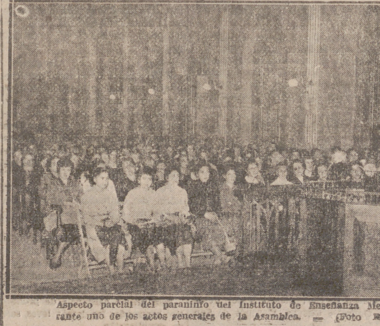
Aspecto parcial del paraninfo del Instituto de Enseñanza Media durante uno de los actos generales de la Asamblea.

Otra de las dificultades nace del reducido ambiente social, la limitación de horizontes que en la vida social se les ofrece a nuestros pueblos. El orden de sus ocupaciones y preocupaciones habituales es muy estrecho. No tienen estímulos o elementos de superación. Apenas si reciben el periódico, si tienen una biblioteca, un cine o un esparcimiento artístico o deportivo. De ahí que la mentalidad de nuestros aldeanos se haga muchas veces limitada, reducida. Y como es en el orden intelectual, ocurre en los demás órdenes. Ello determina que corrientemente se hagan escépticos, desconfiados, cerrados a toda influencia. Excesivamente apegados a su tradición, sus métodos rutinarios, se muestran reacios a toda novedad y para muchos de ellos la A. C. es una novedad. Por otra parte, suele darse en estos ambientes rurales un espíritu pronunciadamente positivista, sumamente utilitarista. Y los que viven en él no es extraño que, con su limitada mentalidad, se pregunten: «¿Para qué nos sirve la A. C., si hasta ahora, nos hemos pasado sin ella? y permanecemos indiferentes.»