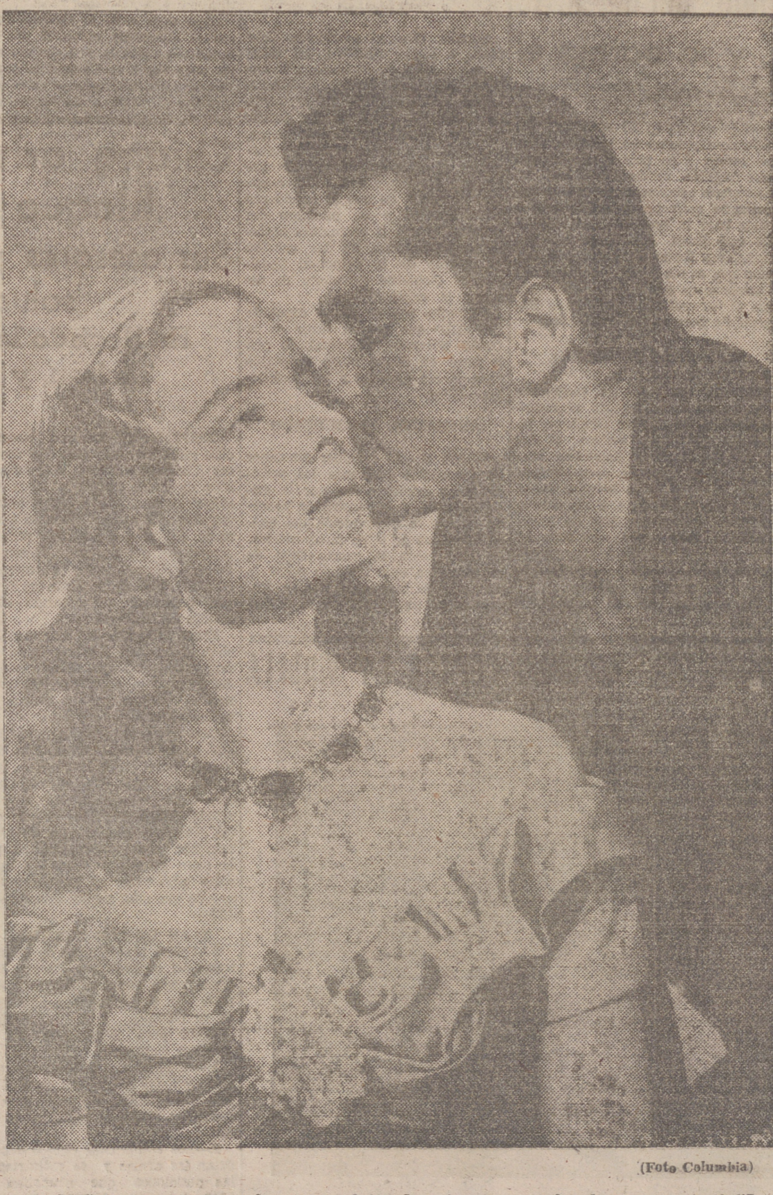
Mañana, en el Olympia, con carácter de estreno sensacional, se proyectará «La espada de Montecristo» (en technicolor), con el galán de moda: John Derek, y de la firma Columbia Films. Una gran película de aventuras, llena de acción, emoción, interés, amor... Película de ambiciones! (No deje de ver al maestro de la escrima, John Derek.)