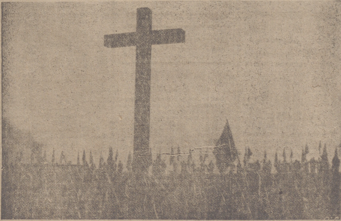
Cuando los restos de José Antonio fueron llevados desde Alicante a hombros, por los campos de España, hasta su tumba en El Escorial.

Me acomete el escarabajo de la vanidad y exceso de apogeo a las cosas de la tierra el querer dejar en esta coyuntura cuenta sobre algunos de mis actos; pero como, por otra parte, he arrastrado la fe de muchos camaradas míos en medida muy superior a mi propio valer (demasiado bien conocido de mí, hasta el punto de darme esta frase con la más sencilla y contraria sinceridad), y como-incluso he movido a innúmeros de ellos a arrostrar riesgos y responsabilidades enormes, me parecería desconsiderada ingratitud alejarme de todos sin