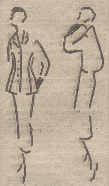
Las líneas que presenta el Dique Platante esta temporada es una adaptación para la mujer española de las dos tendencias más acusadas en París.