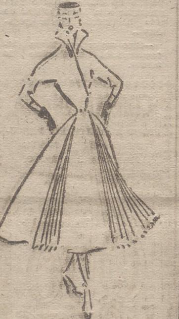
Abrigo entallado, con falda semi-plisada con otomán negro, para las tardes de otoño

¿Qué influye para que los niños mientan? Lo que más influencia tiene en la honestidad infantil es el hogar. Se ha visto que mientan menos los niños que provienen de hogares cultos, donde existe gentileza de carácter y armonía familiar. También se comprobó que mientan más los niños de escuelas públicas que los de colegios privados. Los niños empiezan a mentir, más o menos a los cinco años. Las inexactitudes o falsedades que puede decir un niño antes de esa edad, constituyen más bien fantasías verbales o imaginativas que no tienen relación con la mentira deliberada.