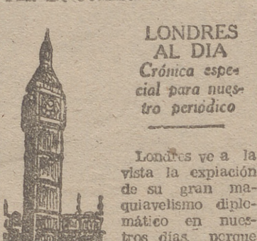
LONDRES AL DIA Cronica especial para nuestro periodico

Y ACUSA A PARIS Y WASHINGTON DE SABOTAJE EN GINEBRA Y DE ESCAMOTEAR EN EL SUDES TE ASIÁTICO; SE QUIERE ROMPER LA COMMONWEALTH EN BENEFICIO NORTEAMERICANO