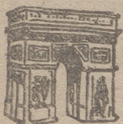
PARIS AL DIA Cronica especial para nuestro periodico

BURDEOS PRESENTA UNA GRAN EXPOSICION DE PINTURAS: FLANDES-ESPAÑA-PORTRUGAL