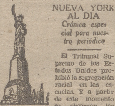
NUEVA YORK AL DIA Cronica especial para nuestro periodico

AL OTORGAR LA IGUALDAD RACIAL EN LAS ESCUELAS A LOS NEGROS, SE DA UN RUDO GOLPE A LOS DEMOCRATAS Y SE ATRAEN A LOS ANTI-COLONIALISTAS