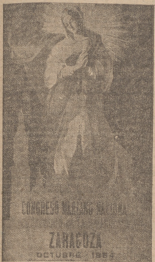
Para anunciar el Congreso Mariano Nacional que, por acuerdo de la Conferencia de Evdmos. Metropolitanos y con motivo del centenario de la definición del dogma de la Inmaculada Concepción, va a celebrarse en Zaragoza en el próximo mes de octubre, ha sido confeccionado el bello cartel que reproduce el grabado al que acompañan estas líneas.