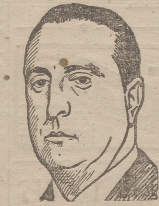
El ministro español de Asuntos Exteriores, don Martín Artajo.

—Nadie ha hablado, que yo sepa, de la revisión de los tratados. Por el momento, basta con que el resultado sea la legalidad del Protectorado.