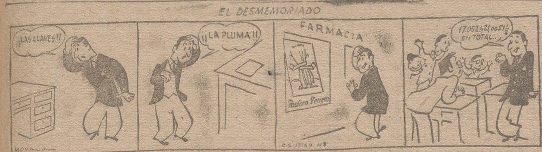
¡TOME 'FOSFORO FERRERO' Y SERA SIEMPRE EL PRIMERO