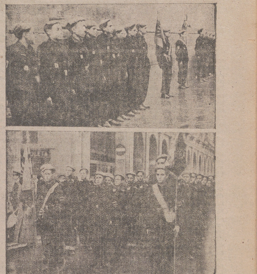
Arriba: La Guardia Juvenil de Franco formada ante el Muro de los Caídos. Abajo: Momento de iniciar el desfile ante las autoridades y jerarquías.

Trece años se han cumplido desde que, en la prisión de un Alicante dominado por los rolos, cayera para siempre José Antonio Primo de Rivera.