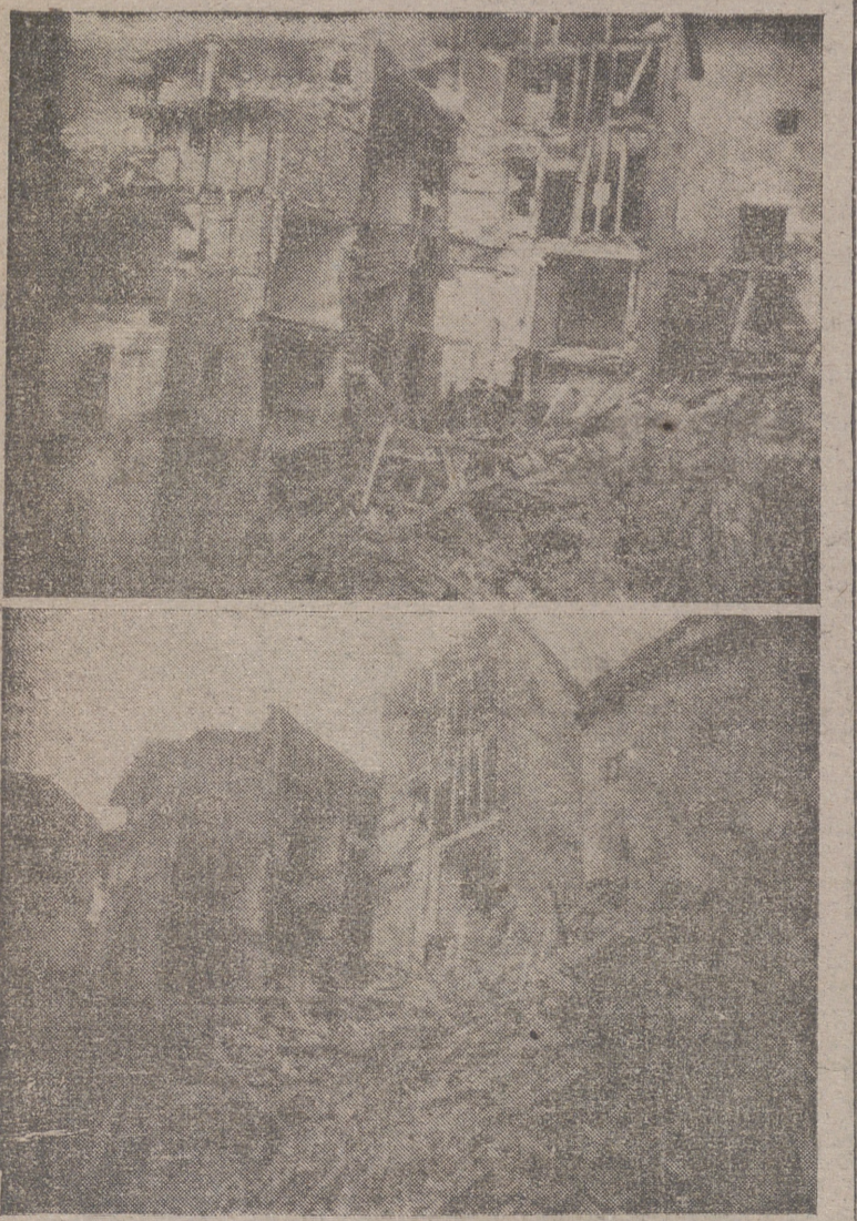
Los aspectos del estado en que ha quedado el grupo de casas hundidas tras pasados en Soto en Cameros, suceso del que dio cuenta nuestro corresponsal en la expresada localidad, en la información que publicáramos el pasado jueves.