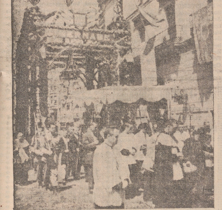
El Pallio, con el Santísimo en manos del señor Abad, pasando bajo el arco levantado ante la Casa Consistorial. (Foto y grabado Cortés Payá)

Logroño entero presenció el paso de la solemne procesión