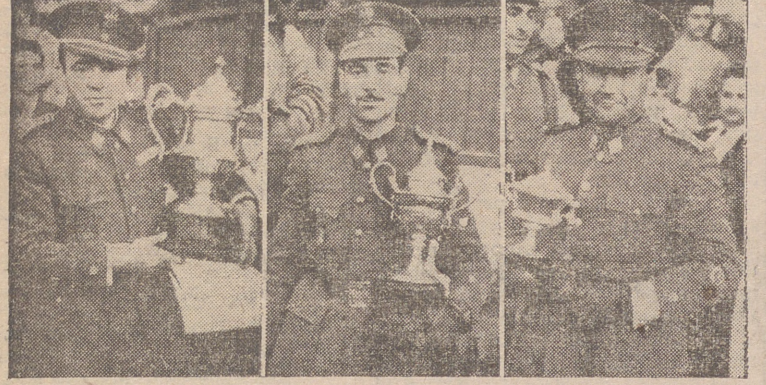
Los tres primeros clasificados en cada una de las dos pruebas. (Fotos y grabado Cortés Payá)

Con un éxito rotundo se celebraron las Pruebas Hípicas señaladas para la festividad del Corpus. Exito de público que, pese a la tormenta que descargó unos minutos antes de la hora marcada para iniciar las pruebas, se apretó hasta lo inverosímil en torno a la magnífica pista del Ramo de Guerra. Exito de los jinetes, algunos de los cuales montaron excelentes caballos de depurada escuela. Y éxito del noble, difícil y espectacular deporte, pues el numerosísimo público que en su gran mayoría contemplaba por primera vez pruebas de esta clase, inmediatamente entendió las bases fundamentales del reglamento y siguió con gran interés y emoción todas las incidencias, aplaudiendo con entusiasmo las mejores intervenciones y animando a todos los jinetes. Bien podemos decir—valga la frase—que con sólo una muestra ha echado ya raíces en nuestra ciudad el deporte hípico.