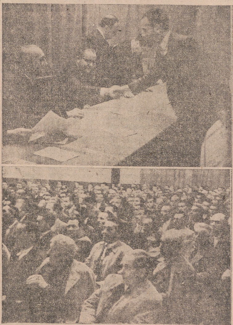
Arriba.—Momento de entrega por las autoridades de los certificados de asistencia a los cursillistas.