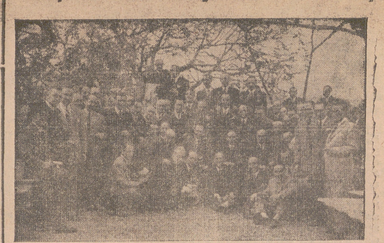
Los médicos logroñeses tributaron ayer un cordialísimo homenaje al eminente doctor don Ramón Castroviejo. La foto muestra a un grupo de asistentes al acto rodeado al célebre oftalmólogo. (Información en la página sexta).