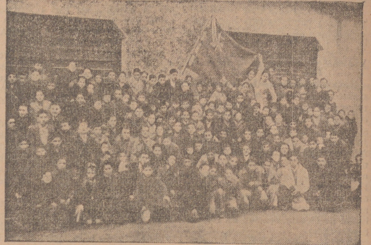
Los «Boscos», agrupados alrededor de su bandera en la fiesta del Santo Patrono del Centro. (Foto y grabado, Cortés Payá)