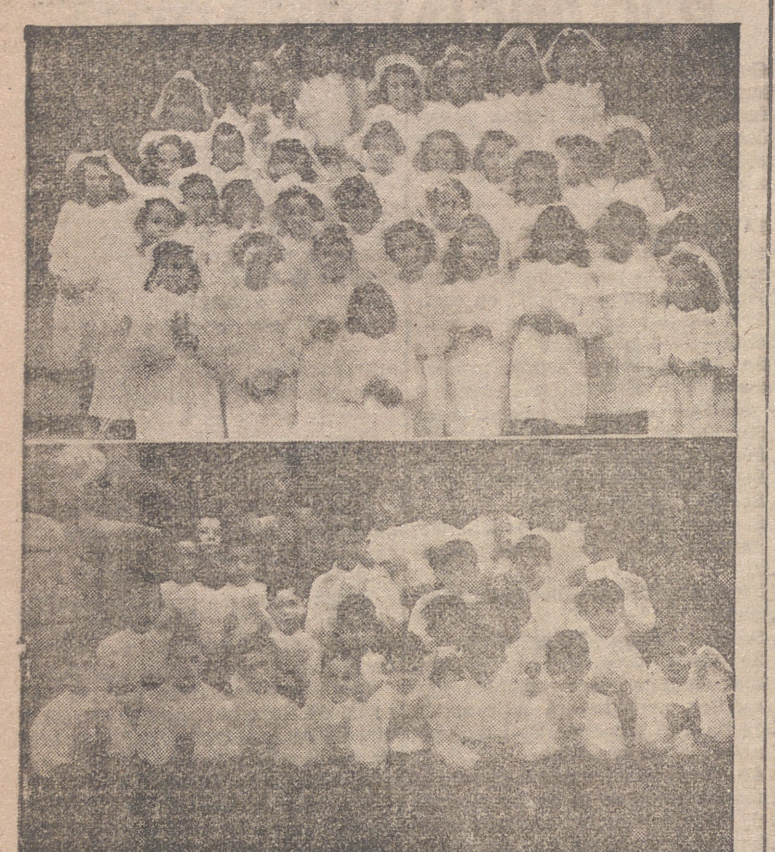
Grupo de niñas y niños que, preparados por la Sección Femenina de F. E. T. y de las J. O. N. S., recibieron por primera vez el Pan de los Angeles, anteayer, domingo.