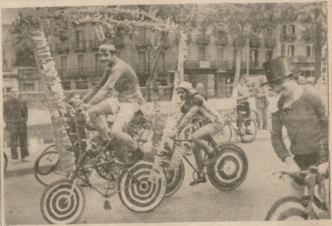
Con gran animación se ha celebrado en Barcelona la "Fiesta del Pedal". Del Arco del Triunfo partió una caravana, integrada por bicicletas de todas las épocas, a la que daba "color" la indumentaria deportiva de algunos participantes.