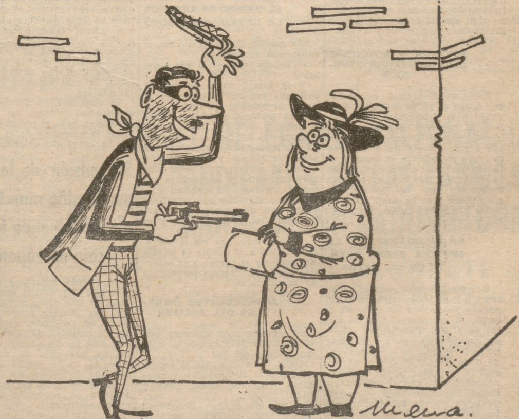
—Buenos días, distinguidísima señora. ¿Tendría usted la gentileza de entregarme, de buen grado, si no le sirve de molestia, cuantas monedas porta en su estupendo bolso?