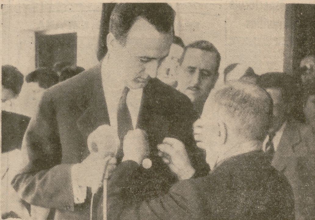
El alcalde de Hoyo de Manzanares, don Fausto Martín, impone la medalla de oro del Ayuntamiento al ministro de Educación Nacional, señor Ruiz-Giménez, que llegó a la localidad para proceder a varias inauguraciones.

Entrega de diplomas a los alumnos del Curso de Criminología en la Escuela de Medicina Legal