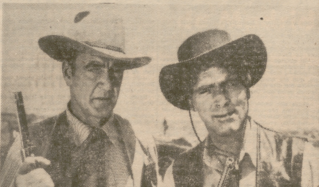
Gary Cooper y Burt Lancaster, los más famosos del cine, actúan juntos por primera vez en la soberbia superproducción, en technicolor, "Vera Cruz", auténtica joya del séptimo arte, considerada como la mejor película en su género. Presentada por C. B. Films, el estreno de "Vera Cruz" se anuncia para en breve en Madrid.