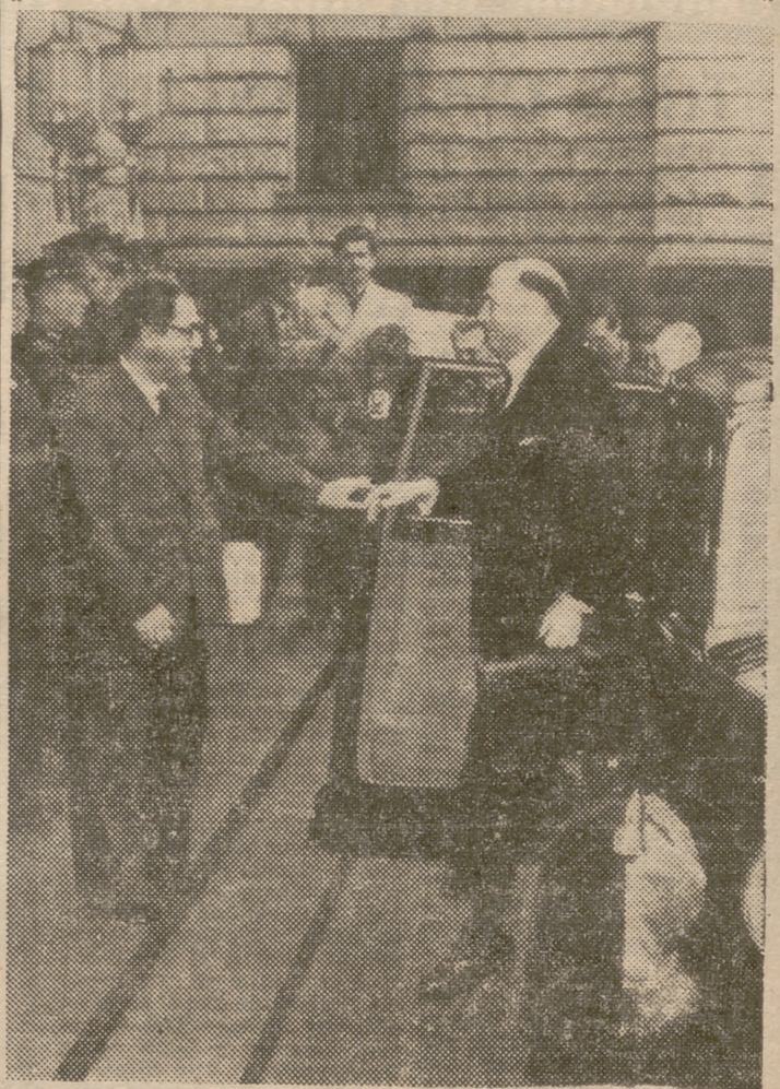
Los representantes de las tres grandes potencias han solicitado conversaciones con el alto comisario soviético en Berlín para resolver el conflicto del tráfico con el Berlín occidental, agravado por los altos impuestos fijados por los rusos. En la foto vemos al embajador británico, sir Frederick Hoyer-Millar, llegando ante la Embajada soviética del Berlín oriental.