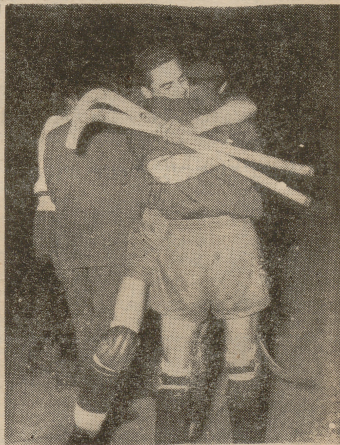
He aquí los primeros testimonios gráficos de la memorable jornada del deporte español en Milán, donde nuestro equipo nacional de hockey sobre patines se proclamó brillantemente campeón mundial de la especialidad, título que releva y consigue por tercera vez. El grabado superior recoge el momento en que numerosos españoles residentes en Milán irrumpen en la pista del Palacio del Deporte con banderas y pancartas en una expresión de alegría por el triunfo de España. En la fotografía central aparece el capitán del "cinco" español entregando a su colega de Italia una figura de Don Quijote como recuerdo del encuentro entre ambos equipos. Y, por último, una vez terminado el partido, los jugadores españoles se abrazan como muestra de júbilo por el preciado galardón conseguido tras un duro torneo en el que terminaron invictos.