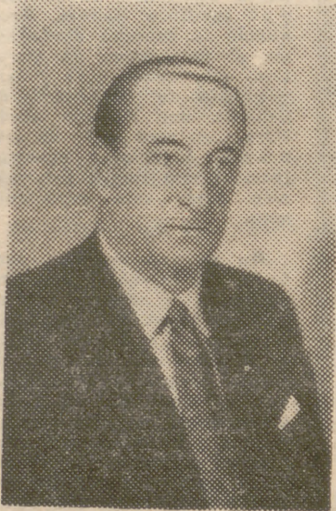
Don Vicente Puyal, director general del Instituto Geográfico y Catastral

H ACE ya mucho tiempo que entre la abundante producción bibliográfica española se registra la falta de un atlas nacional o peninsular, en el que el investigador, el estudiante y el simplemente curioso, encuentren reunidos gráficamente cuantos datos puedan referirse a cada zona o punto del territorio español. La ejecución de este atlas, tras minucioso estudio previo, ha sido iniciada estos días por la entidad de máxima solvencia científica en la materia: el Instituto Geográfico y Catastral. Y es el ilustre señor director general del Instituto, don Vicente Puyal, quien nos informa: