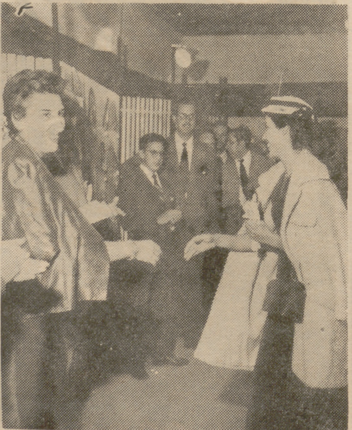
El sábado último se hizo entrega de los premios a los artistas galardonados en la Exposición de Abanicos, organizada por la Asociación de Dibujantes y Galerías Preciados. Nuestra foto recoge un momento de dicho acto