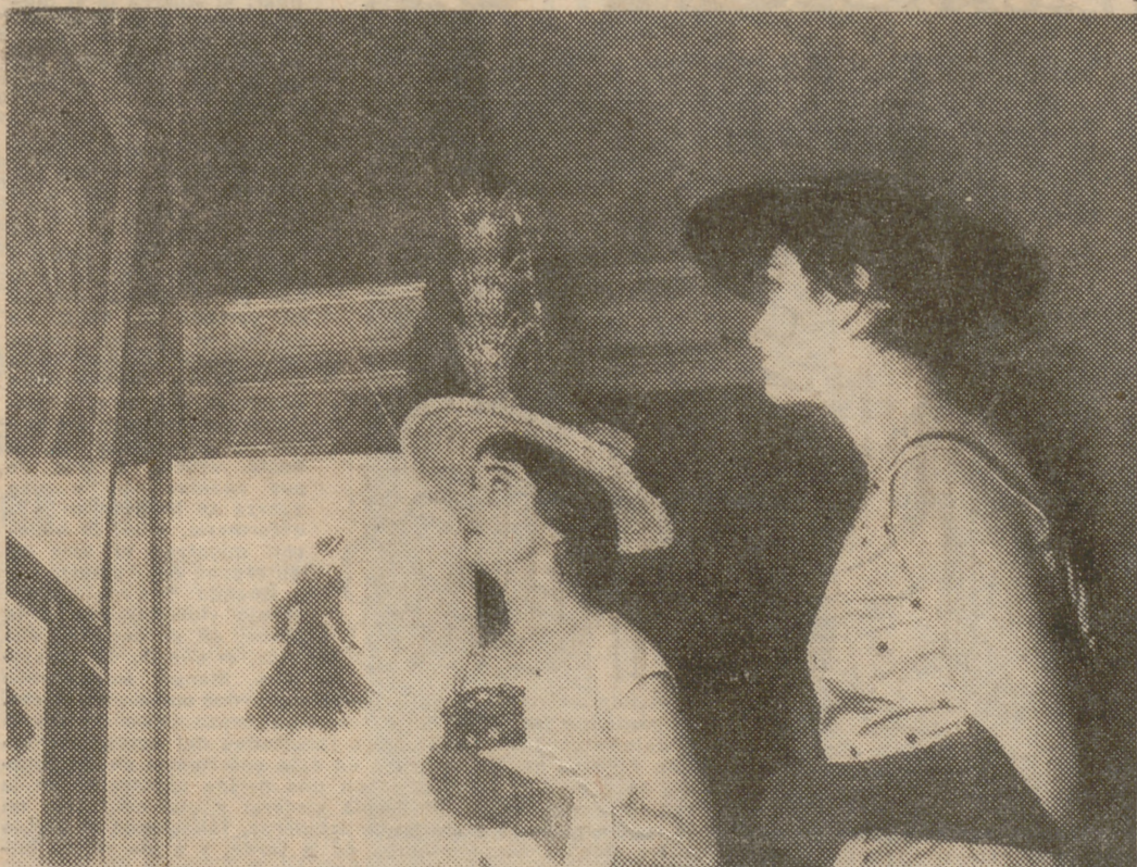
Desde ayer ha quedado abierto en el hotel Palace el III Salón Nacional de Dibujos de Alta Costura, en el que figuran cuatrocientas obras. Las bellas y elegantes damas asistentes a la inauguración recorrieron con el especial interés que patentiza esta foto los espléndidos dibujos presentados al certamen por los dibujantes especializados en modas femeninas. El prestigio alcanzado en sólo tres años por este salón—patrocinado por el Sindicato Textil y organizado por los modistos españoles—es tal que su celebración ha sido acogida este año en el extranjero con muestras inequívocas del mejor interés.