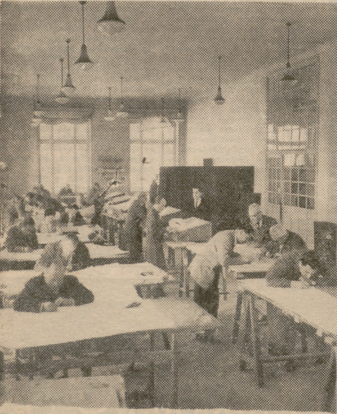
Equipos de ingenieros, ayudantes, topógrafos, delineantes, etcétera, han sido seleccionados y se encuentran en la actualidad dedicados a la confección del "Atlas general de España"

—¿Qué tiempo se estima que tardará en realizarse? —Del orden de dieciocho meses poco más o menos.