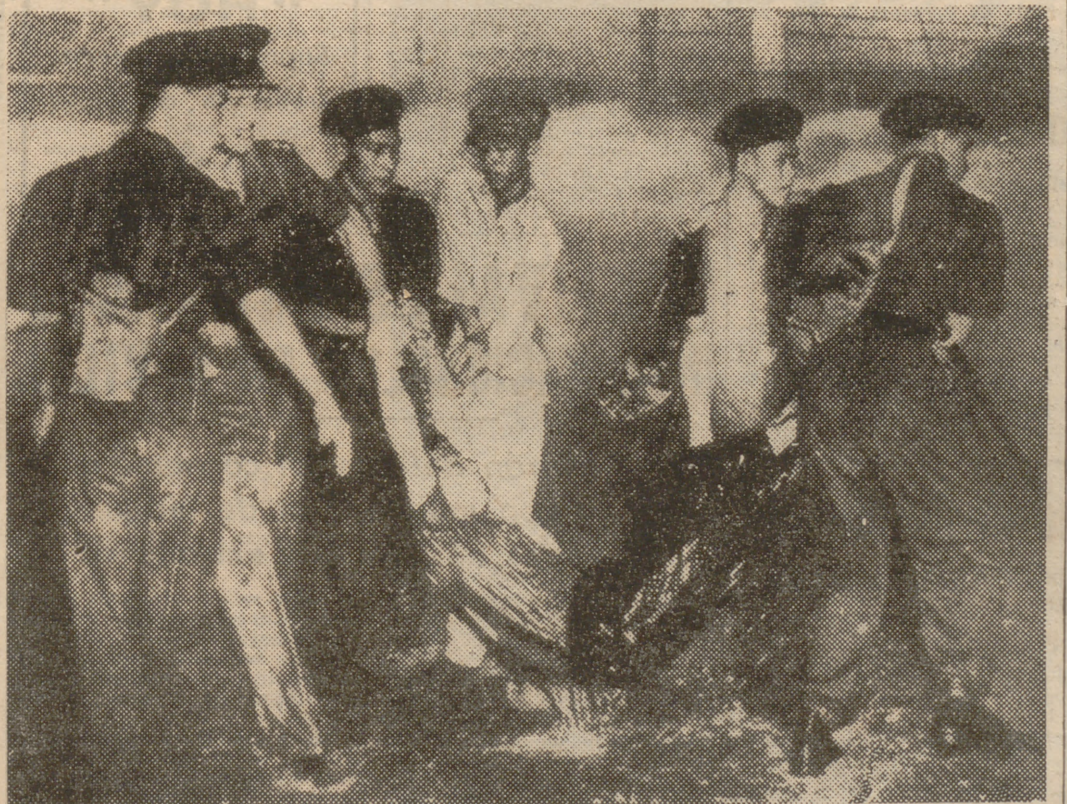
En Singapur se produjeron, durante la última semana, disturbios provocados por los huelguistas. Uno de los propósitos de éstos era paralizar el tráfico rodado por la ciudad. Aquí vemos a un grupo de policías indígenas que, dirigidos por un oficial inglés, expulsa de la forma tan poco cortés que presenta la fotografía a uno de los huelguistas que se había introducido en una estación de autobuses con objeto de dificultar su salida.