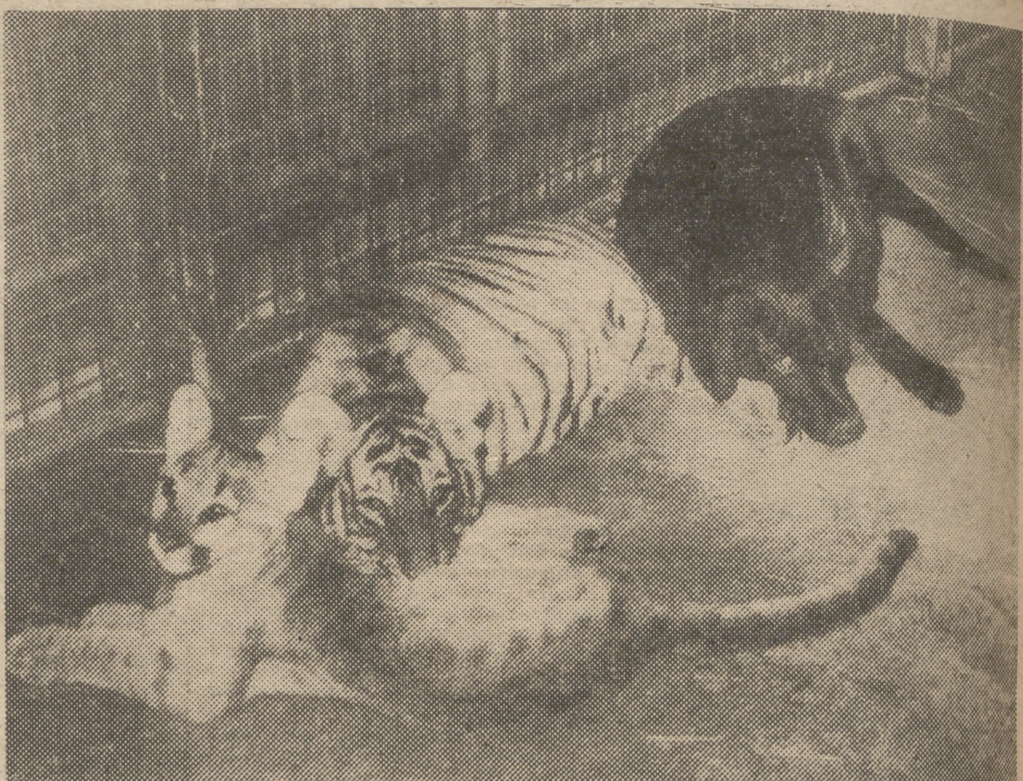
IDILIO ZOOLOGICO He aquí una extraña muestra de amistad animal. En el Parque Zoológico de Wuppertal conviven en una misma jaula una perra de caza, una joven tigresa y un puma, animales que hasta el momento parecían irreconciliables enemigos. Como se ve, existe una buena amistad entre ellos

accidente ocurrió exactamente en el kilómetro 85.