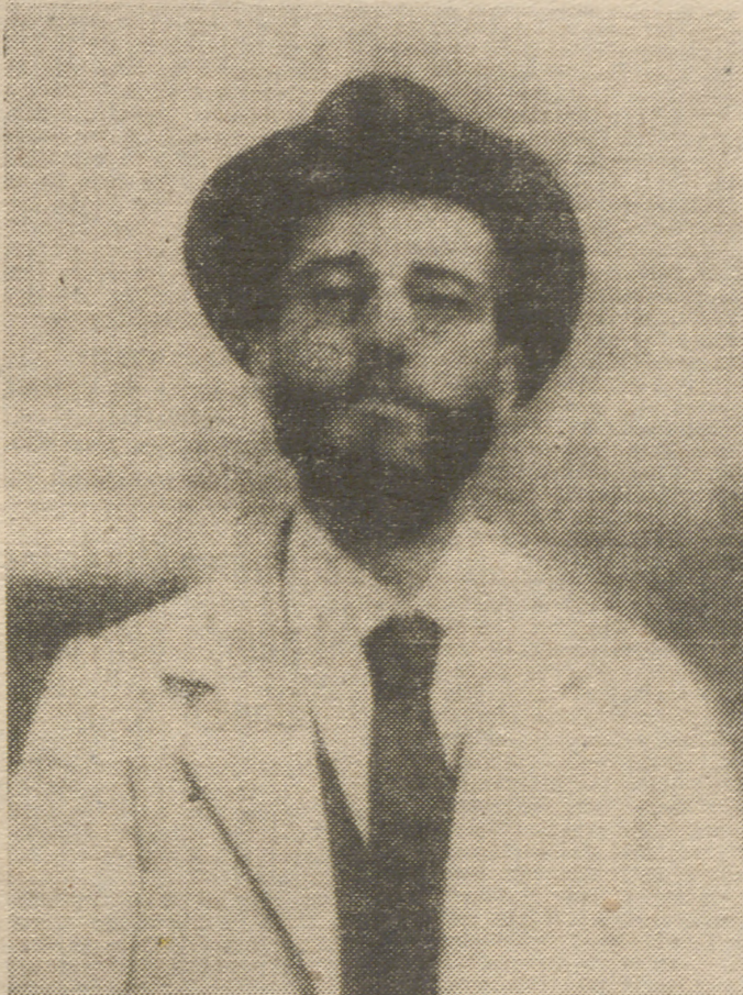
El anarquista Angiolillo, fotografiado en la cárcel de Vergara, donde fué ajusticiado el día 20 de agosto de 1897

En tanto que la "Gaceta" del 9 de agosto insertaba un Real decreto del Ministerio de Estado, que firmaba la Reina Regente, doña María Cristina, por el que se disponía que el teniente general don Marcelo de Azcárraga se encargara interinamente de la Presidencia del Consejo de Ministros, y el de la Gobernación daba cuenta a los gobernadores civiles del infame asesinato cometido en el balneario de Santa Agueda, sin omitir el detalle de la impresión producida en la capital de la Nación por la noticia de tan trágico e inesperado suceso, que privaba a la Patria y a la Monarquía de los servicios que todavía podían esperarse de quien tantos y tan extraordinarios los había prestado en el transcurso de su larga y gloriosa carrera, el cadáver del presidente asesinado fué trasladado a Madrid, depositándose en la capilla ardiente, instaladas en "La Huerta", su suntuosa residencia del paseo de la Castellana, por