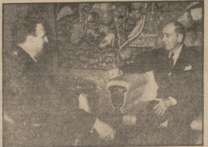
El ministro de Asuntos Exteriores, don Alberto Martín Artajo, recibió en su despacho al nuevo embajador de la República Dominicana, don Emilio García Godoy, que le hizo entrega de la copia de estilo de sus cartas credenciales.