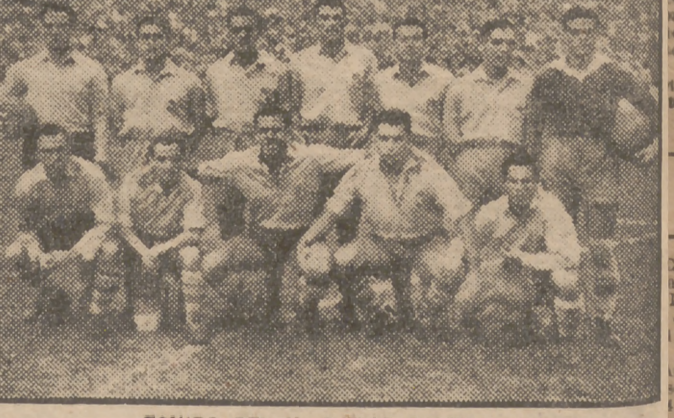
EQUIPO DEL U. D. LAS PALMAS