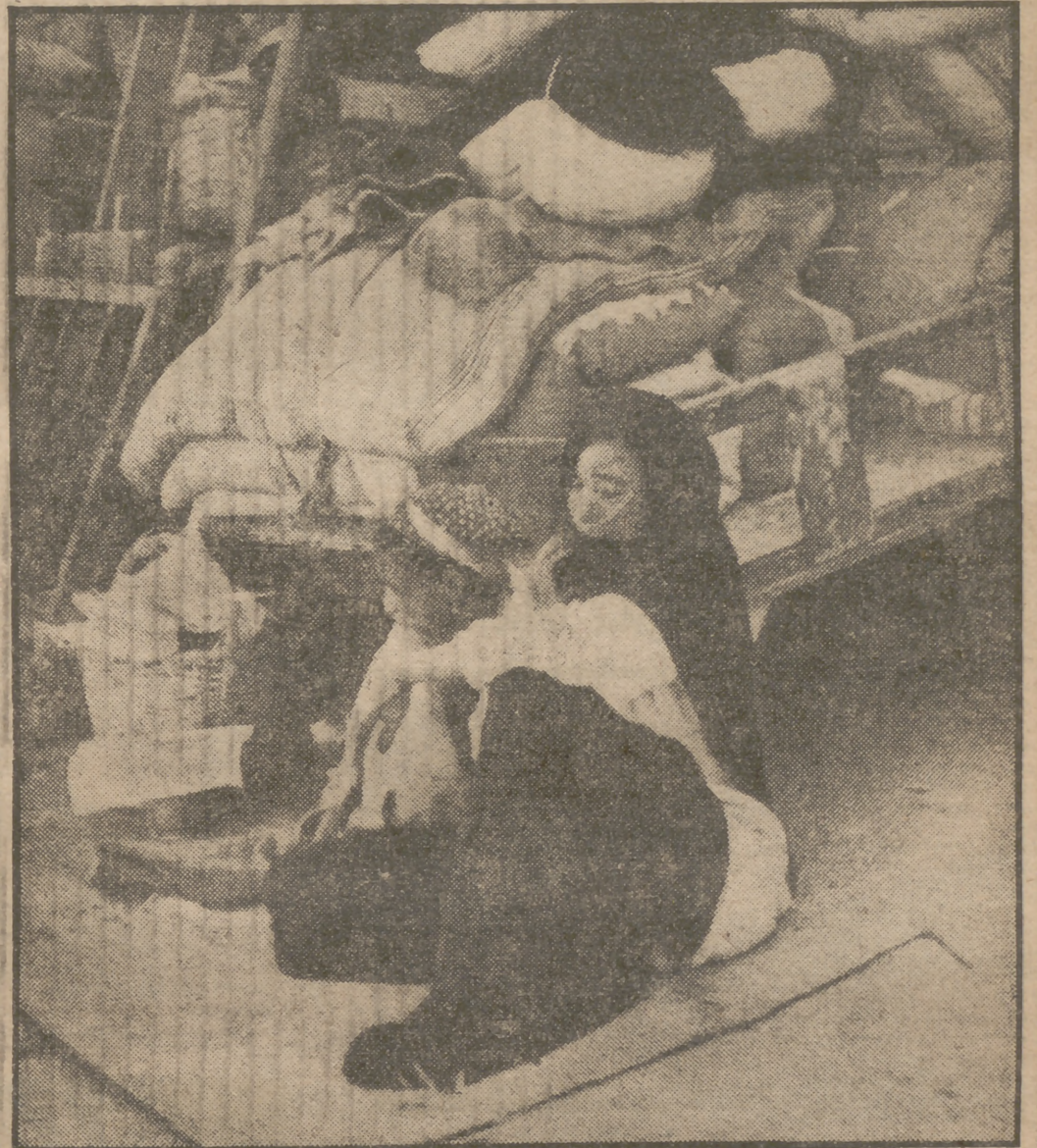
La despiadada característica de estos tiempos que vivimos es el exodo de las gentes. Ningun hogar está seguro. Las gentes se ven obligadas a despidarse, eligiendo la muerte lenta al librarse de la fulminante provocada por la guerra. Y allá van de un lado para otro familias y enseres. Esta vez ha tocado el triste panorama a los egipcios que vivían en la zona del Canal de Suez. Esas mujeres llorosas y su carro repleto de cachivaches sintetizan esa terrible actualidad, a la que se añade la protesta egipcia contra la violación inglesa de los derechos humanos. Por de pronto, la inmensa mayoría de los países árabes apoyan las reivindicaciones egipcias.