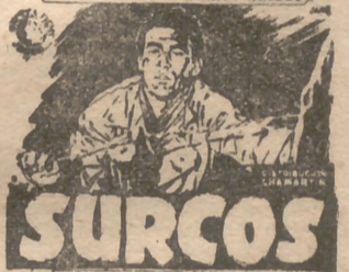
Director: J.A. NIEVES CONDE