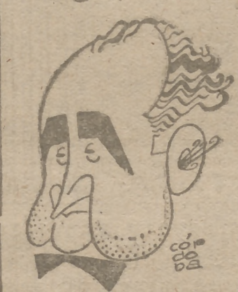
MAESTRO MORENO TORROBA