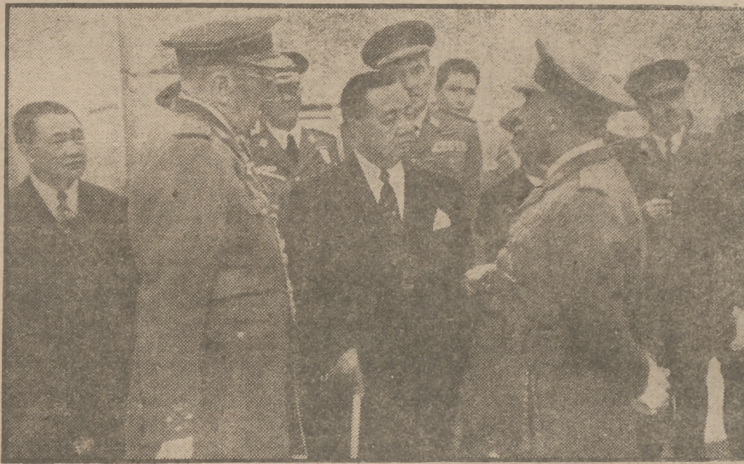
El jefe del Estado, Generalísimo Franco, explica al Presidente Quirino, durante la visita realizada ayer tarde a las gloriosas ruinas del Alcázar toledano, detalles del asedio, en presencia de su heroico defensor el general Moscardó.