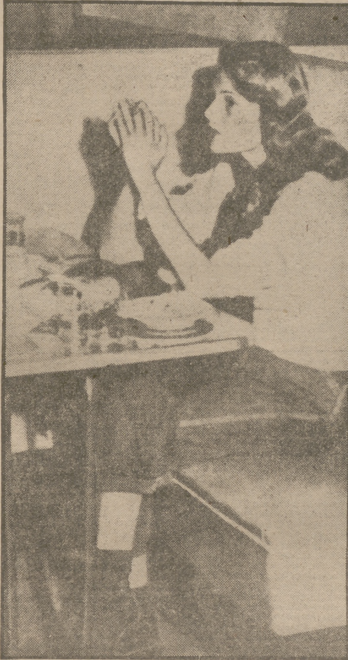
Rita Hayworth, fotografiada en Reno después de su divorcio

Curioseando por los pasillos me encontré un simpático em-