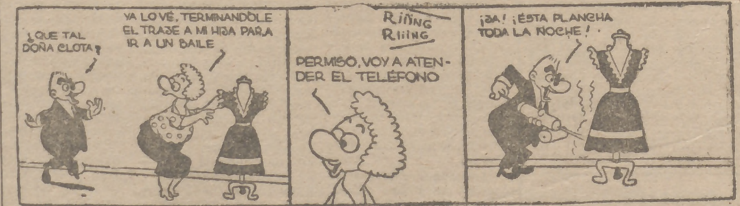
[De "Crítica", de Buenos Aires.]