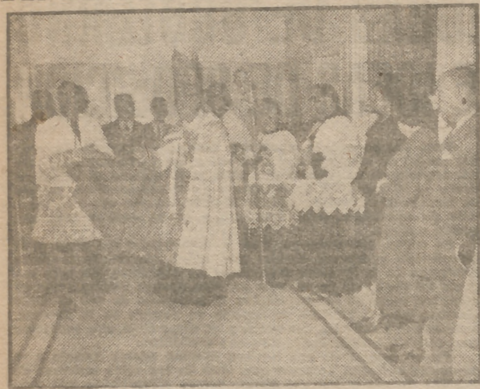
El patriarca de las Indias Occidentales, obispo de Madrid-Alcalá, doctor Eijo-Garay, bendijo ayer las instalaciones del nuevo sanatorio San Francisco de Asís, del Instituto de Franciscanos Misioneros de María, establecimiento modernísimo y dotado de los últimos perfeccionamientos.