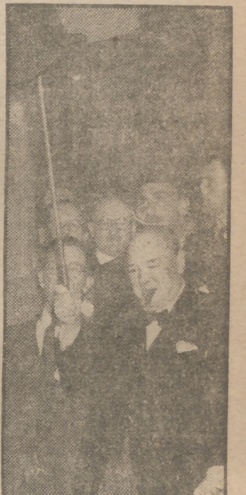
Winston Churchill, jefe de los conservadores británicos, con su sombrero enarbolado, su puro y su rostro jovial, aparece aquí a la salida del estadio de Liverpool, donde ha pronunciado su primer discurso de la campaña electoral.