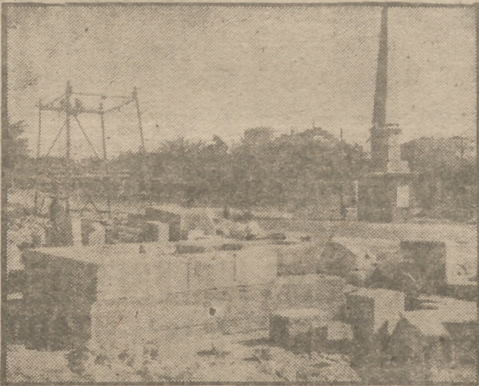
Las pirámides, que dan nombre a la glorieta, a la salida de la calle de Toledo, están siendo cambiadas de lugar para modificar la plaza, ajardinándola y variando la situación de las vías tranviarias. Ahora las pirámides serán colocadas en el centro de la glorieta.

Se modifica el emplazamiento de los monolitos para ajardinar la plaza y variar la circulación tranviaria