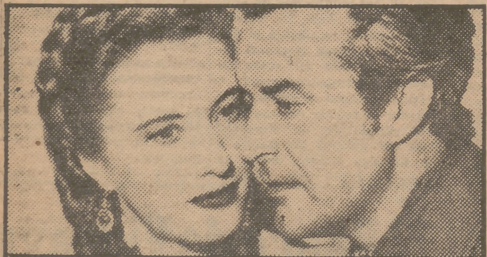
Bárbara Stanwyck y Ray Milland en una escena de la estupenda superproducción en tecnicolor "California", magnífica película de gran éxito que el lunes próximo se estrena en el cine Rialto de Madrid, presentada por Cifesa.