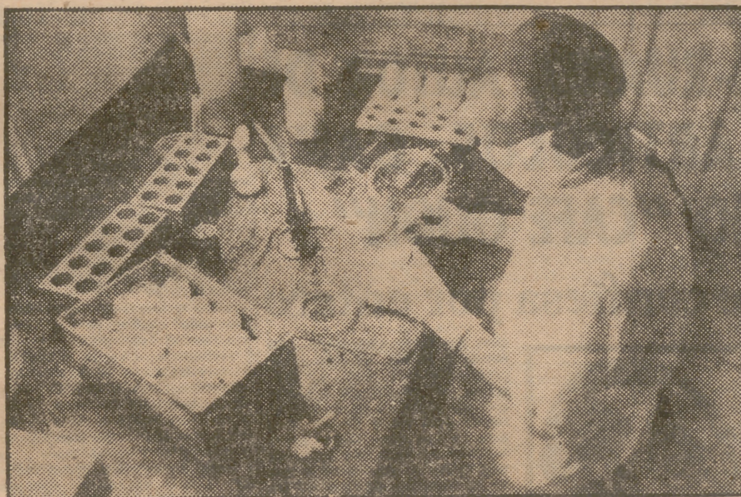
En un laboratorio español se procede a la experimentación del microbio de la gripe en ratones, cobayas, hurones y otros animales. Pareció estar demostrado que los seres a los que les afecta menos la gripe son los perros y los caballos. En la actualidad, gracias a los progresos médicos, la gripe ha perdido su antigua virulencia, y sus ataques son rechazados en todos los frentes.

La enfermedad fué descubierta cinco siglos antes de Jesucristo