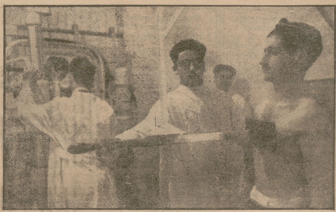
En la Caja de Recluta, núm. 2, de la primera región militar, se dispone de los más modernos métodos de reconocimiento. En la fotografía, parte de las instalaciones del gabinete antropométrico, donde se reconocen hasta mil quinientos reclutas diariamente.

El reemplazo de 1950 está próximo a entrar en filas y los futuros soldados reciben en estos días sus primeros contactos con el ambiente militar. En las Cajas de Recluta de nuestra capital están siendo sometidos a reconocimiento todos los componentes de este reemplazo. En las calles adyacentes del paseo de María Cristina se ven todos esos tipos especialmente escogidos para sorprender la buena fe de los pueblerinos. Vendedores de peines, de navajas, de máquinas de afeitar, de llaveros, etc., están ofreciendo la mercancía activamente "para el servicio militar", según sus pregones.