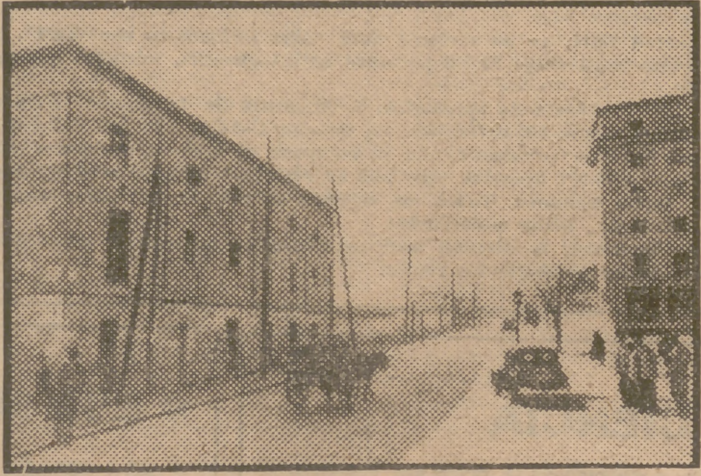
Calle de Antonio Leyva. Entrada por glorieta del Puente de Toledo. Salida al campo.

De muros adentro, todas las miserias de un cerco que se prolonga... y también todas las glorias; hambre, escasez de agua, casas en que las familias italianas han de mantener y dar alojamiento a los soldados, revueltos por la merma de pagas, enfermedades que amenazan convertirse en epidemia... y un tercio que no se rinde. Para su gloria y la de su patria, el capitán que dirige aquel ejército, Antonio de Leyva, ha salido con todo el mal genio y la fozudez de un buen navarro en momento de inspiración, que para él se prolongó toda la vida; aquella sangre que, cuando solamente quedan unos gotas escasas en las venas sabe decir, si se le interroga acerca del número de los vencidos, un lacónico "contad los muertos", esa sangre alía y tenaz, nervio y pulso de la empresa española, se le asomaba al capitán en cuanto le pinchaban. Y no olvidemos que otro navarro, el de Javier y de Asia, y del mundo, tuvo el genial desparpado a lo divino que quererse morir conquistando con la mirada la tierra que una muerte intempestiva para su ilusión le impedía conquistar a marcha de apóstol. Eso, de muros adentro. Fuera, cargando repleidamente sobre el límite mural, estrecha tierra de nadie, el Ejército francés de Francisco I, que no parece dispuesto a renunciar a la rendición de Pavia y a la prisión de su tropa. (El río Tesino se ha negado a desviarse a la presión de los diques, seguramente por simpatías para los sitiados y, rompiendo su barrera, sigue procurando aguas a los de la ciudad).