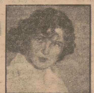
Irene Castle, en 1917

La mayoría de nuestros lectores no habrán conocido en la escena a Irene Castle. En la película, sí, porque de su vida matrimonial y artística se realizó una cinta bastante buena, con Fred Astaire como protagonista masculino. Aquella obra cuenta el apasionado amor de los esposos Castle y cómo la muerte de él, en un accidente de aviación, tronchó para siempre la vida de ella. La película así termina.