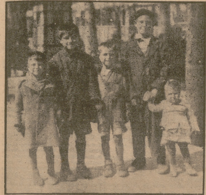
Estos cinco niños esperan que se les coloque en un colegio. Tienen la madre enferma. Cinco hermanitos, que en la familia sólo encontrarán un contagio mortal. Hay que salvarlos.

PARA EMPEZAR, TRANSMITO EL CASO NUMERO 1 DE ESTA NUEVA ETAPA, EN LA FOTOGRAFIA ADJUNTA.