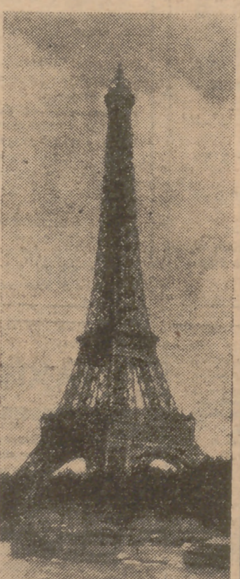
Durante el mes de julio los dos barcos-mosca del Sena efectuarán una histórica excursión a Ruan, a unos 80 kilómetros de París.

El 10 de junio fué fijado para la Fiesta de Rabelais, en los Halles el mercado conocido con la designación del Ventre de París. Allí, y entre montículos de frutas, salchichas, verduras y flores, actuarán malabaristas, funámbulos y danzarines provinciales.