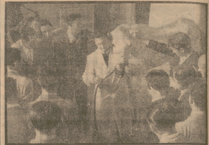
Ha sido clausurado el cursillo de capacitación agropecuaria organizado por la Junta de Hermandades de la Delegación Nacional de Sindicatos. Nuestra foto recoge una de las clases.