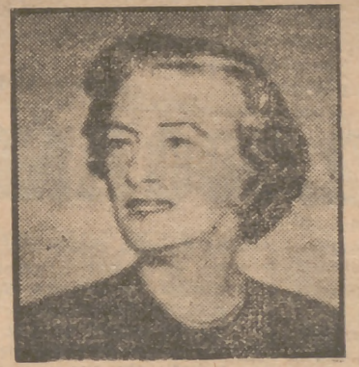
Irene Castle, a los 67.

La mayoría de nuestros lectores no habrán conocido en la escena a Irene Castle. En la película, sí, porque de su vida matrimonial y artística se realizó una cinta bastante buena, con Fred Astaire como protagonista masculino. Aquella obra cuenta el apasionado amor de los esposos Castle y cómo la muerte de él, en un accidente de aviación, tronchó para siempre la vida de ella. La película así termina.