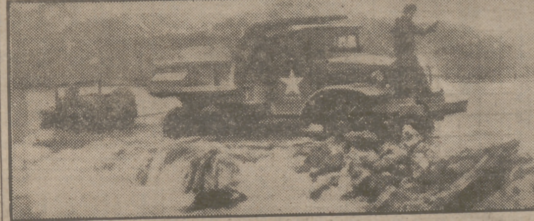
Las patrullas surcoreanas entraron ayer tarde en Seúl, capital de Corea del Sur, y fuerzas norteamericanas que han atravesado el río Hangehon se concentran para seguir su avance hacia el paralelo 38. Continúan los aliados sin encontrar resistencia enemiga, y el problema se centra ahora, cuando los soldados de MacArthur se encuentran a menos de 30 kilómetros de aquella línea ideal, en si han de rebasar ésta o no. (Amplia información de la guerra de Corea en páginas centrales.)