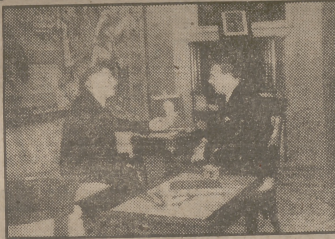
El ministro turco en Madrid, que ha muerto hoy, durante una de sus recientes conversaciones con el ministro de Asuntos Exteriores, señor Martín Arriago.

Fué el primer diplomático extranjero que se reintegró a su puesto después del acuerdo de la O. N. U.