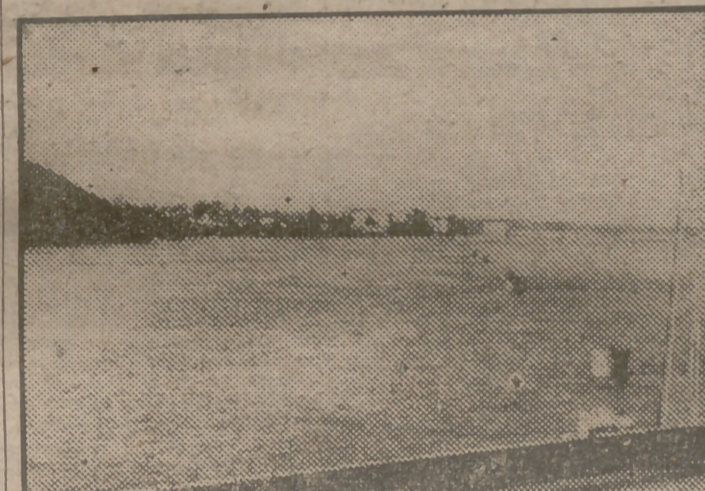
Imponente aspecto que presenta el río Guadiana a su paso por Badajoz, que en su desbordamiento ha inundado extensas zonas de terreno próximas a sus márgenes.