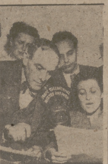
Sinfonía en re menor, Jotas, guía comercial, Capítulo de novelas, zambra, guía comercial.

TODOS LOS JUEVES "P A N" por RADIO NACIONAL, a las 9