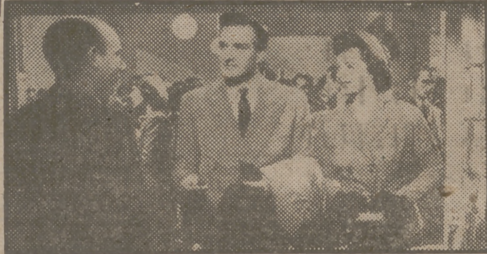
Margaret Lockwood y Paul Dupuis, la gran pareja artística del cine inglés, en una escena de "Odio en la sombra", que el próximo lunes, presentada por Chamartin, se estrenará en el lujoso cine Avenida.