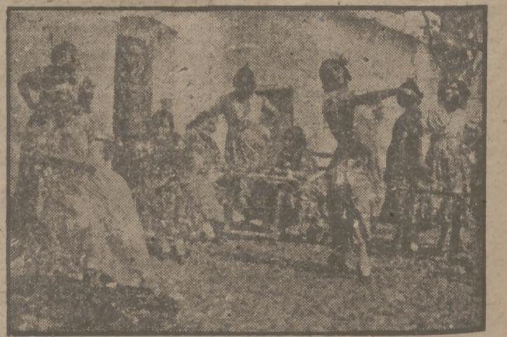
Guitarras, vino, palillos, fiesta, alegría, jarana, catorce o quince chiquillos y treinta y cinco gitanas.