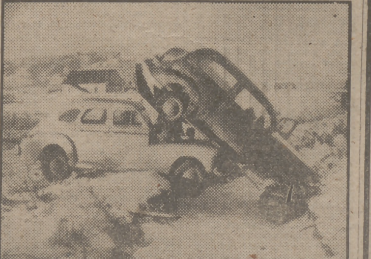
Este aparatoso accidente automovilístico tuvo lugar recientemente en Missoula, Estado de Montana (EE. UU.). Afortunadamente no hubo que lamentar desgracias personales, aunque los dos vehículos quedaron bastante deteriorados, como se puede apreciar en la foto. El accidente ocurrió debido a las grandes nevadas. Los conductores no pudieron controlar sus coches. Otro resbalón más en la nieve..., pero sin consecuencias funestas!