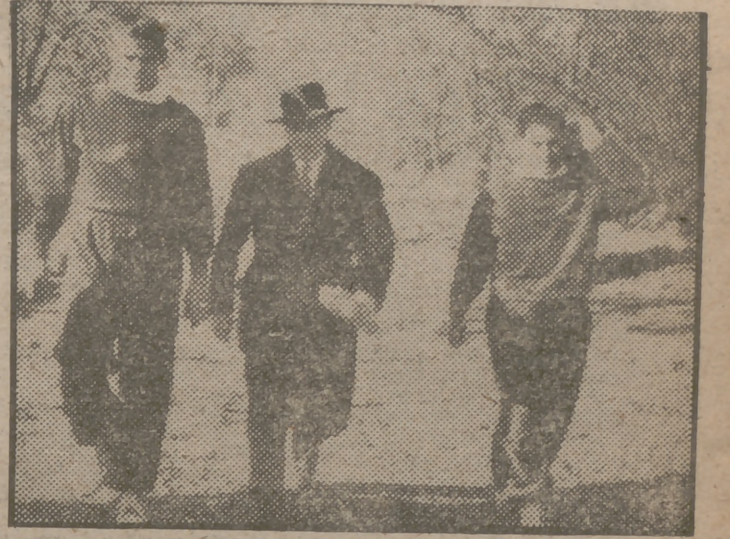
Córdoba, entre Puchades y Bustos, en marcha hacia los pinares del Escorial.