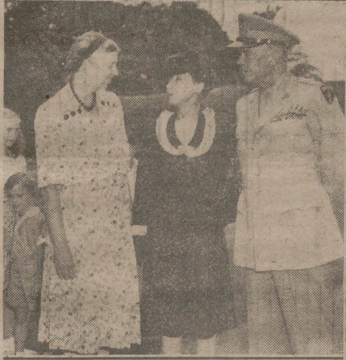
El matrimonio Eisenhower fotografiado junto a la viuda de Roosevelt.