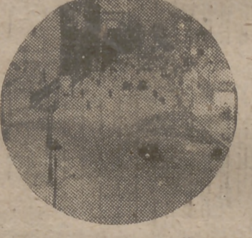
guiante transbordo, llegar a cualquier punto servido por el Metro.

túnel en la plaza de España hasta Carabanchel Bojo, a través de toda la Casa de Campo y zona de Campamento. Posteriormente, y ante la necesidad de facilitar un transporte rápido y adecuado a la zona de prolongación de la Castellana hasta la nueva estación de Chamartín, manteniendo este gran sector con el centro de la capital, pensó que la primitiva idea del ferrocarril Carabanchel-Plaza de España debíamos proponerlo en la forma de ferrocarril metropolitano desde la plaza de España, para, subterráneamente, por la plaza de Santa Bárbara y luego por la calle Fernández de la Hoz, sirviendo a los nuevos Ministerios y por la gran avenida de nueva apertura, paralela a la avenida del Genovés, llegar a la estación de Chamartín. Se tiene el pensamiento de llegar a los acuerdos oportunos para cruzar este ferrocarril en distintos puntos estratégicos con las estaciones del Metro, con lo cual, desde Carabanchel o Chamartín se podría, con el con-