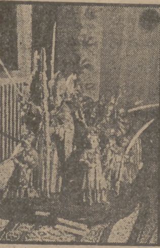
"Domingo de Ramos", magnífica talla en madera de José Liso, que figura en la Exposición Nacional de Artesanía