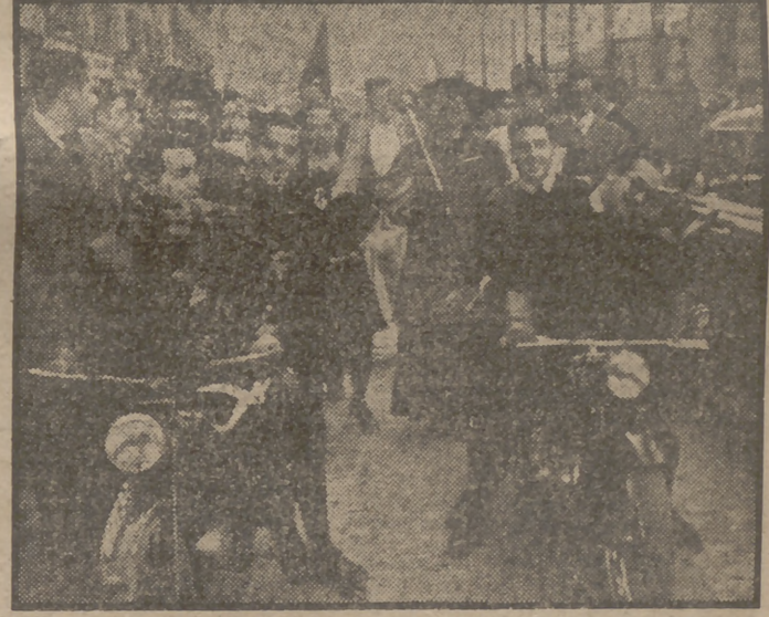
Un aspecto del pintoresco cortejo formado por los alumnos del quinto año de la Facultad de Derecho, que han celebrado hoy la fiesta del Rollo.

En el Paraninfo de la Universidad Central, y organizada por los estudiantes de quinto año de la Facultad de Derecho, se ha celebrado hoy la fiesta del rollo.