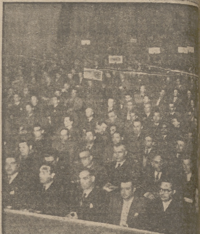
Un aspecto de la sala del teatro Madrid, donde tres millones de campesinos se reunieron con ocasión de la Asamblea de Hermandades.

Esta tarde, en los locales del Consejo Nacional, Palacio del antiguo Senado, proseguirá sus tareas esta Asamblea, desde las cinco. (S. I. S.)