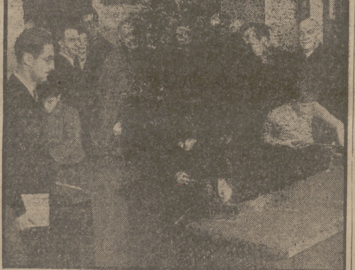
El ministro de Educación Nacional, señor Ibáñez Martín, ha visitado la Ciudad de los Muchachos del Puente de Vallecas...

Las empresas en que se coloquen contarán con obreros perfectamente capacitados