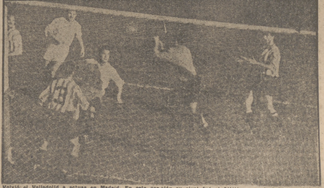
Volvió el Valladolid a actuar en Madrid. En esta ocasión su rival fué el Atlético, que le había vencido el 27 de noviembre en el campo de Zorrilla. Los muchos ocos vallisoletanos confirmaron la magnífica impresión que habían producido siete días antes en Chamartín y fueron en todo momento un difícil enemigo, para los madrileños. Especialmente su línea de defensa se acredió como una de las más sólidas de España, y todo hace presumir que de ellas saiga algún nuevo internacional. La victoria del Atlético se produjo por un tanteo de 2 a 1, ante un público que llenó el Estadio y en una tarde desahogada por el viento helador. En el grabado, un momento de peligro para la puerta de Domingo.